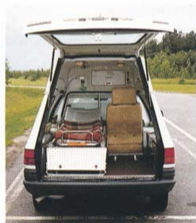
Vue arrière montrant la cellule sanitaire (brancard et oxygénothérapie en option.