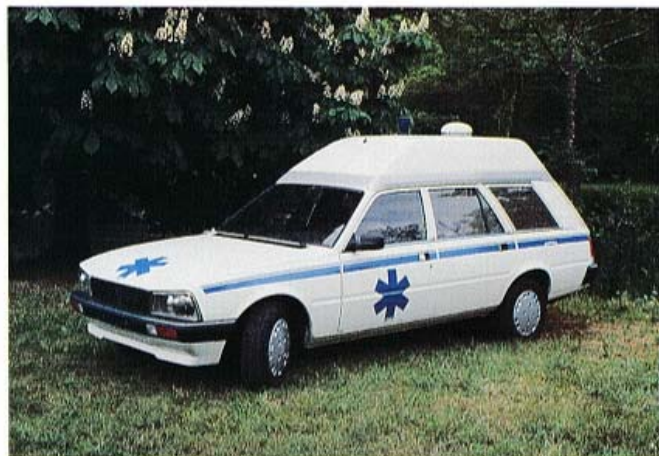
AMBULANCE 505 SURELEVEE HEULIEZ