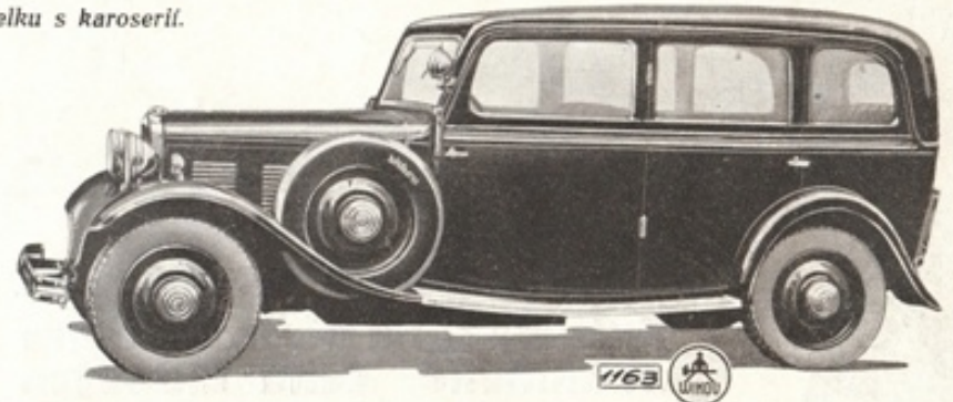
Limousina - 6 sed., 4 dvířková. Na přání skleněná stěna za řidičem.