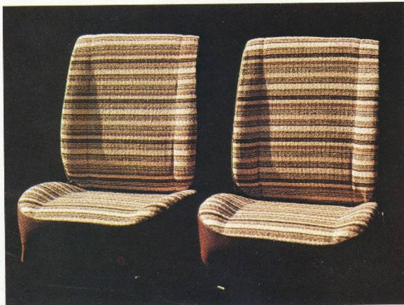
Sièges à dossier réglable.

La Simca 1006 GLS : une voiture coquette et bien finie.