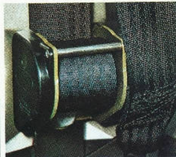
Ceintures de sécurité à enrouleur.