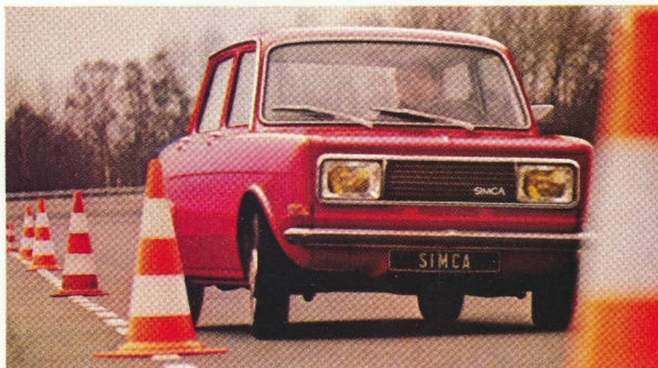
Rayon de braquage