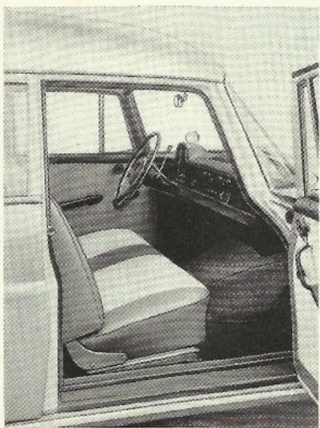
La banquette AV