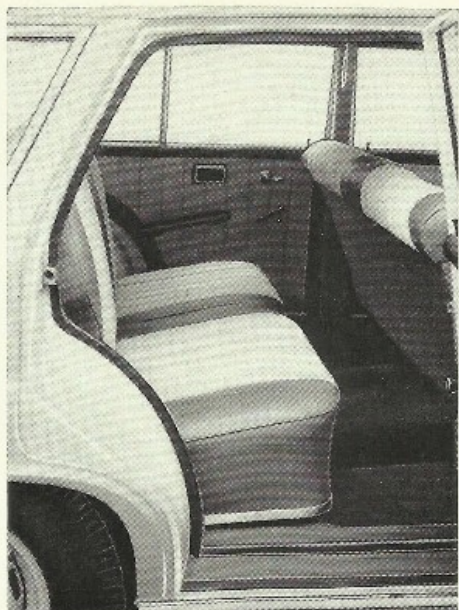
La banquette AR offre place à 3 personnes