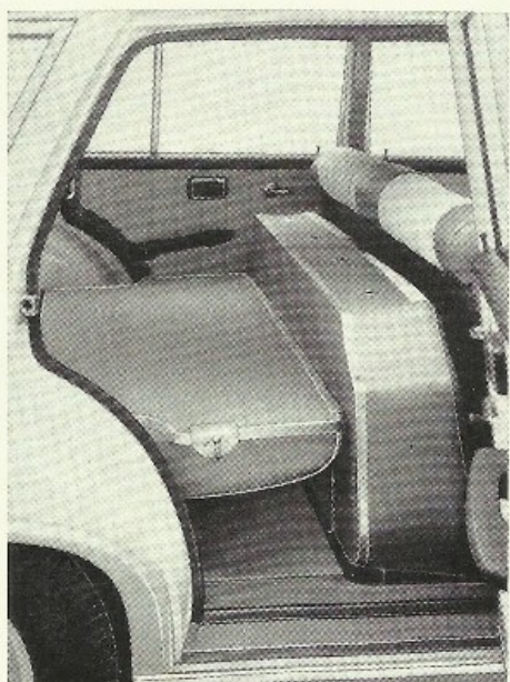
Une partie de la surface de chargement