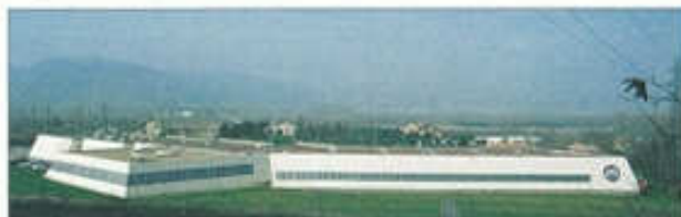
Ligne de montage MEGA - Chanas (38)