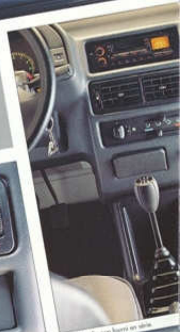
Boîte de vitée sur barre en titane.