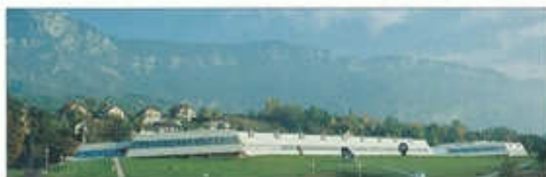
Siège social - Aix-Les-Bains (73)