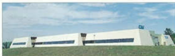
Pièces de carrosserie - Chanas (38)