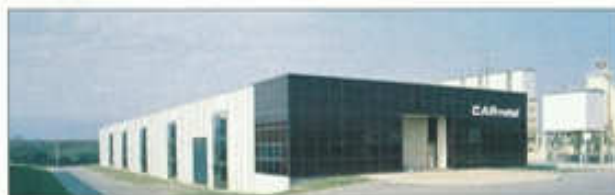
Fabrication des châssis - Chanas (38)