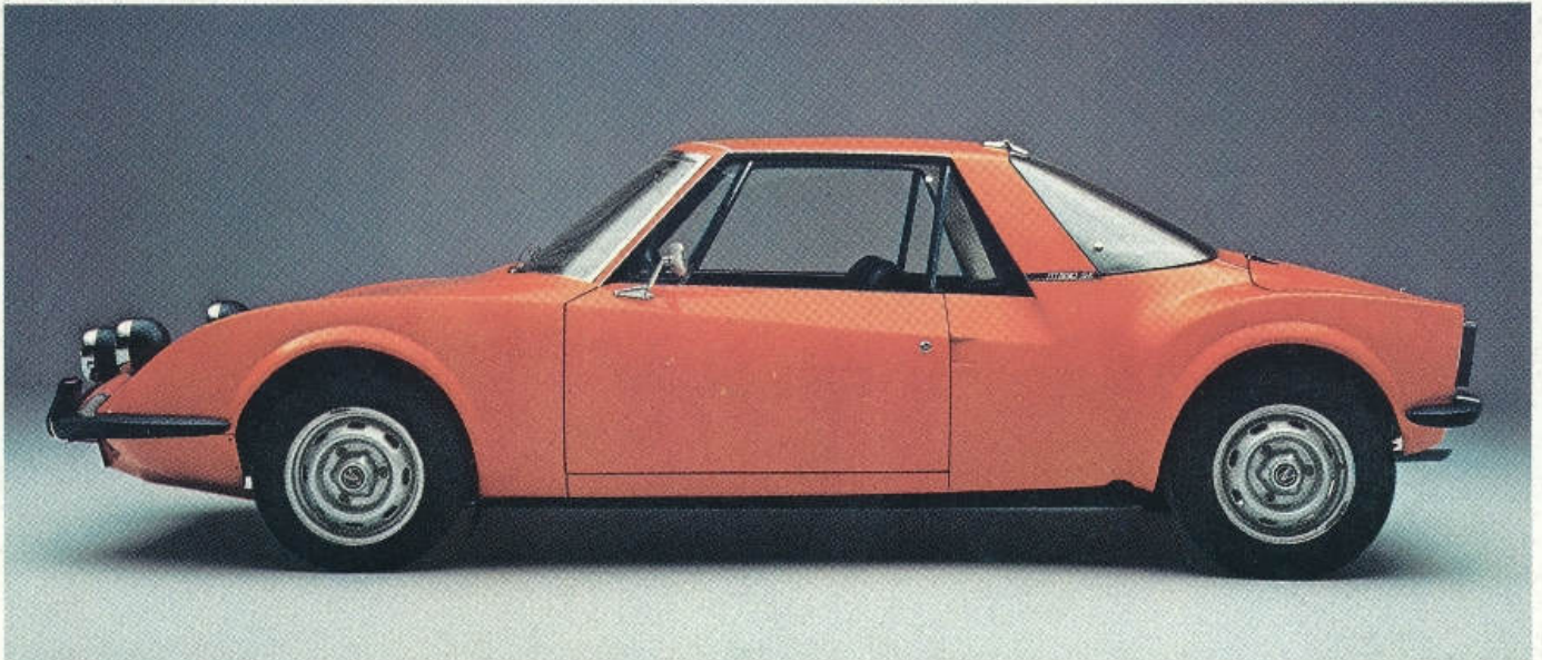
MATRA SIMCA SHELL VAINQUEUR AU MANS 1972

Barre antiroulis. Amortisseurs hydrauliques télescopiques à double effet différentiel.