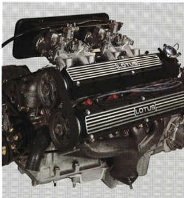
Moteur Lotus 2.2 L. - 16 soupapes.