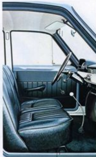
intérieur luxueux et confortable ▲

La CONTESSA 1300 est par excellence la voiture qui par ses performances, son confort, et sa personnalité, offre aux passagers un maximum de joie et de satisfaction sur de très longs trajets et à grande allure.