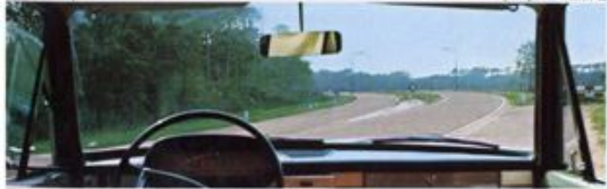
▼ vue panoramique