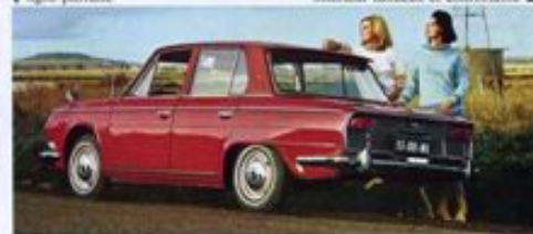
▼ ligne parfaite