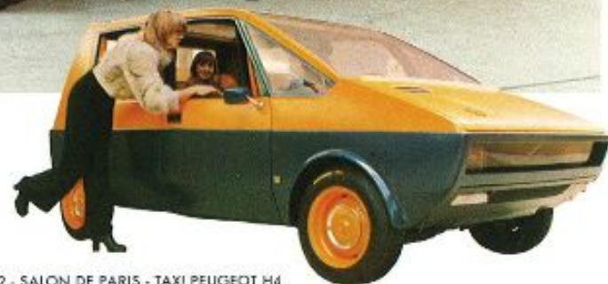
1972.- SALON DE PARIS - TAXI PEUGEOT H4