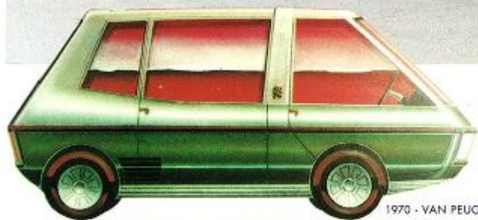
1970 - VAN PEUGEOT