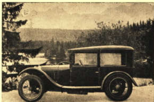
„ENKA“ u Štrbského Plesa v Tatrách.

Motor: Jednoválcový, dvoutaktní, vodou chlazený. Vrtání 85 mm, zdvih 88 mm, obsah 499 ccm. Snímatelná hliníková hlava, hliníkový píst, bohatě dimenzovaná válečková a kuličková ložiska zajišťují spolehlivý chod motoru a zaručují dlouhodobý vysoký výkon při minimální spotřebě pohonných hmot. Mazání děje se směsí oleje s benzinem (40 dkg oleje na 10 kg benzínu), která je vedena z benzinové nádrže o obsahu 16 litrů, umístěné na příční stěně, spádem k automatickému karburátoru. Zapalování dynamobateriové s přerušovačem a cívkou. Spouštěč elektrický Bosch-Bendix.