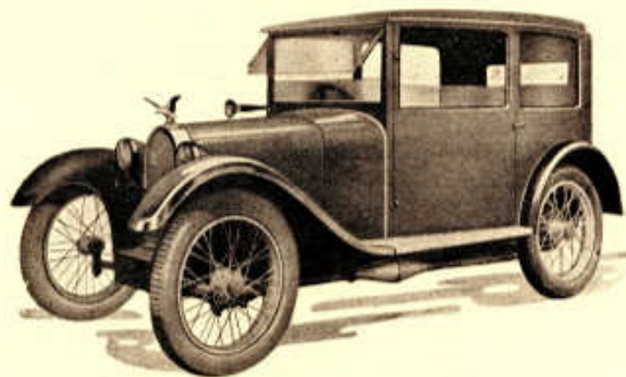
»ENKA« s limousinovou karoserií.

Auto „ENKA“, konstruované na základě několikaletých zkoušek, jest výslednicí myšlenky zpopularisovati u nás dopravu automobilem, t. j. umožniti každému, aby levně, pohodlně, rychle a neodvisle od veřejných dopravních prostředků se mohl pohybovati. Konstrukce „ENKY“ jest řešena se zřetelem na naše silniční poměry, na drahotu provozních látek a garážování. Sestavení vozu »ENKA« jest zcela jednoduché, takže obsluha jeho jest minimální. Tyto výhody »ENKY« spojené s rychlostí až 75 km za hod. a spotřebou 5½–6 litrů benzínu na 100 km opravňují »ENKU«, aby byla označena jako nejekonomičtější vozidlo dnešní doby.