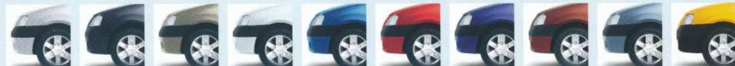
Gri Platine* Gri Comete* Bej Toundra* Artika Albastru Egee* Roșu Passion Albastru Marine Roșu Toreador* Albastru Mineral* Galben Sport