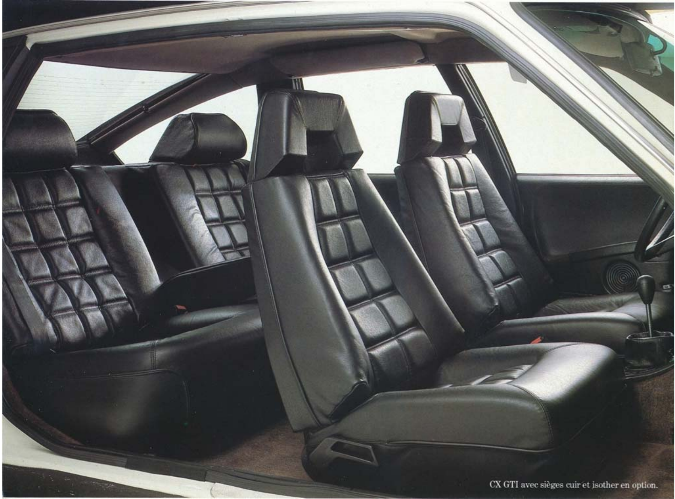
CX GTI avec sièges cuir et isother en option.