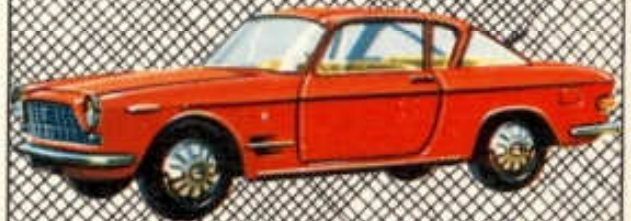
Coupé Fiat 2300 S - N° 80 (107 mm)