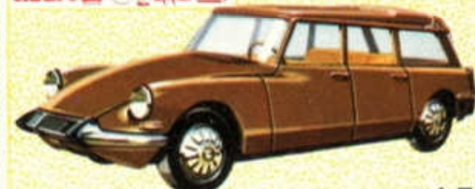
Break Citroën ID 19 - N° 87 (116 mm) 4 F