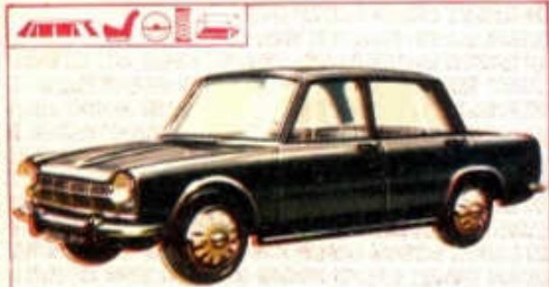
Simca 1300 - N° 30 (99 mm) 3,50 F