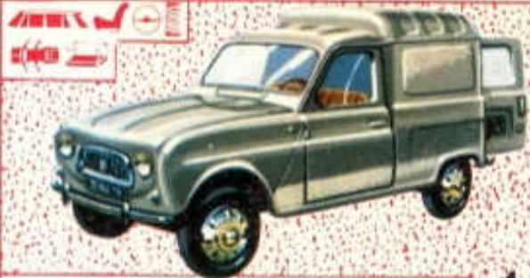
Renault 4 Fourgonnette-N° 65 (84 mm)