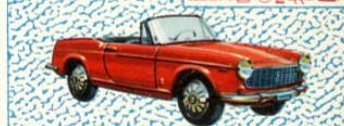
Cabriolet Fiat 1500 - N° 66 (94 mm) 4,50 F