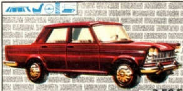
Fiat 2300 Berline - N° 38 (104 mm) 3,50 F