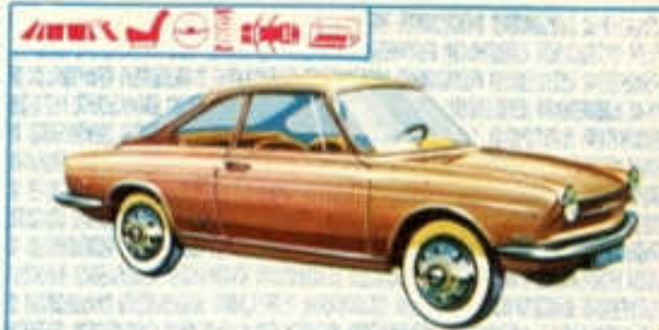
Coupé Simca 1 000 - N° 73 (91 mm)