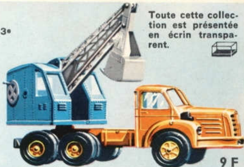
Pelle Mécanique sur Berliet TBO 15 - N° 114 (185 mm) 9 F