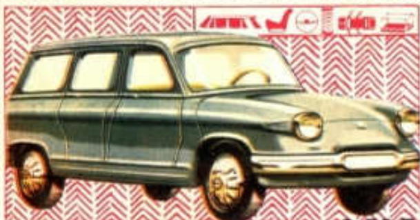
Break Panhard 17 - N° 4 (107 mm) 3,50 F