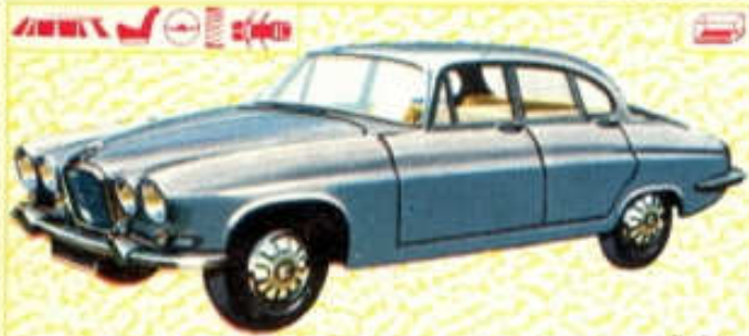
Jaguar MK 10 - N° 19 (120 mm)