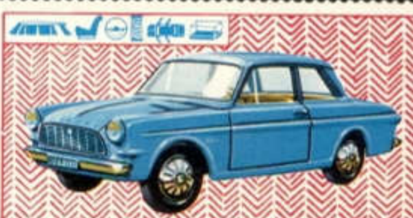
Ford Taunus 12 M - N° 77 (100 mm)