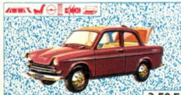
Daffodil Variomatic - N° 31 (86 mm) 3,50 F