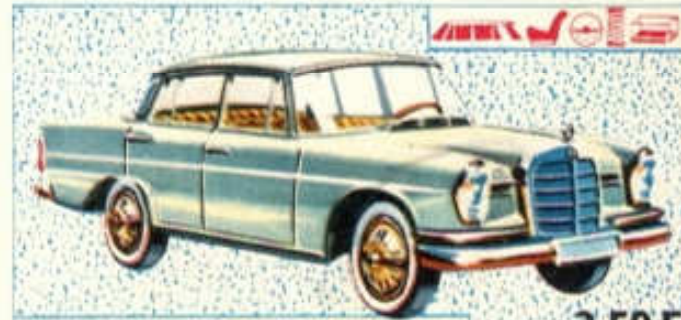
Mercedes 220 SE - N° 49 (113 mm) 3,50 F