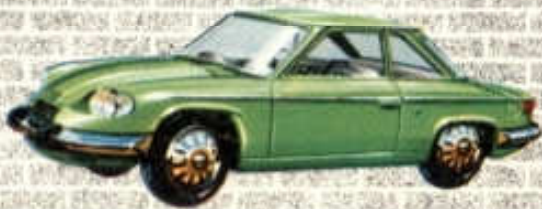
Coupé Panhard 24 CT-N° 72 (99 mm)