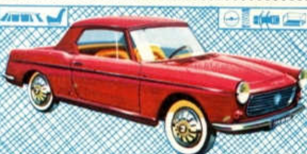
Coupé Peugeot 404 - N° 71 (104 mm)