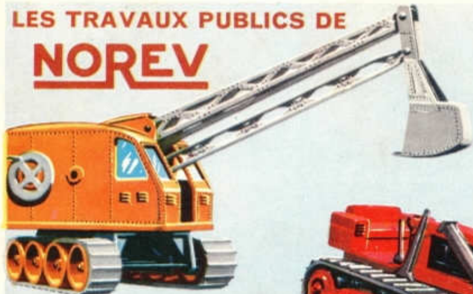
Pelle Mécanique sur chenilles - N° 112 (214 mm) 7,50 F