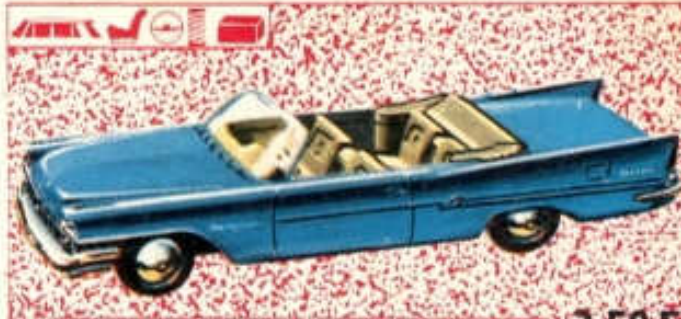
Chrysler New-Yorker - N° 47 (129 mm) 3,50 F