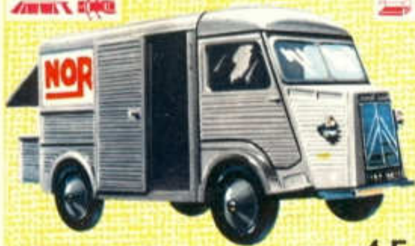
Citroën 1 200 kg - N° 81 (99 mm) 4 F