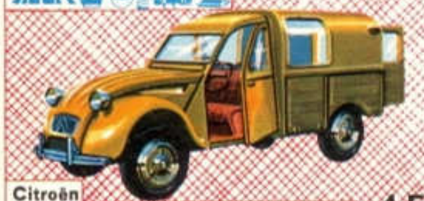
Citroën 3 CV Fourgonnette - N° 82 (88 mm) 4 F