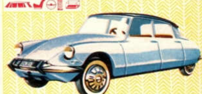
Citroën DS 19 - N° 48 (112 mm) 3,50 F