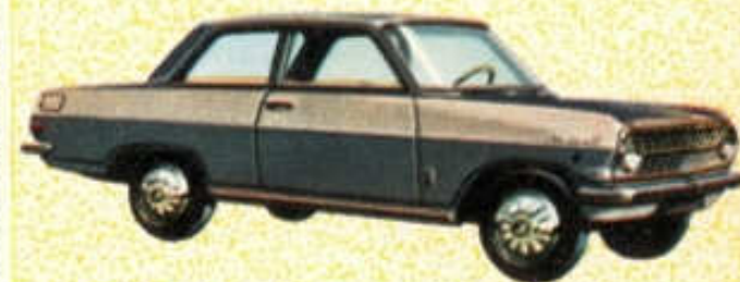
Opel Rekord L 1700 - N° 1 (105 mm) 4,50 F