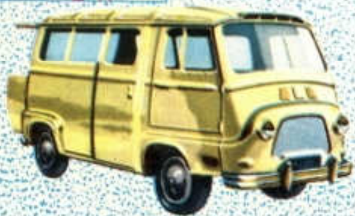
Renault Estafette Car - N° 55 (96 mm)