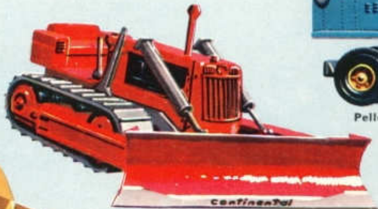
Bulldozer Continental CD 8. N° 111 (124 mm)..... 7,50 F