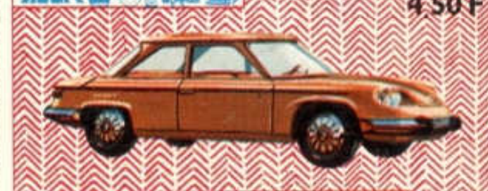
Panhard 24 BT Berline - N° 85 (105 mm) 4,50 F