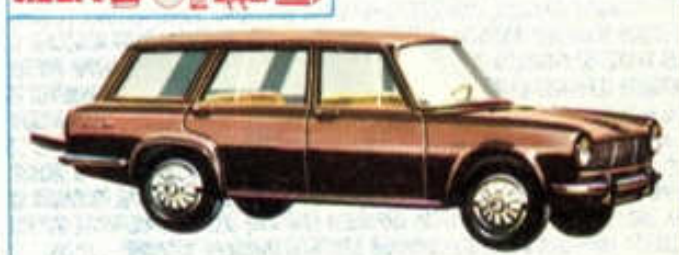
Break Simca 1500 - N° 86 (99 mm) 4 F