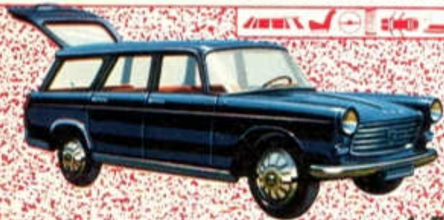
Peugeot 404 Familiale - N° 28 (109 mm)