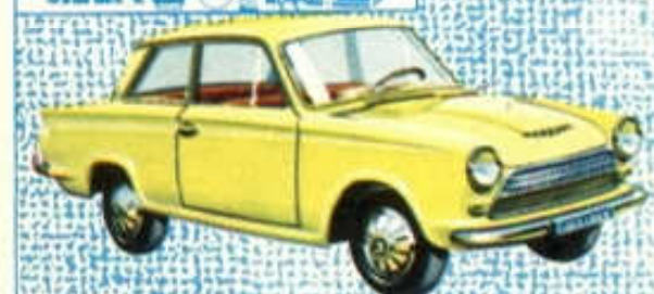
Ford Cortina - N° 84 (100 mm) 4 F