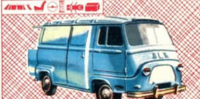
Renault Estafette Fourgon - N° 42 (96 mm) 3,50 F