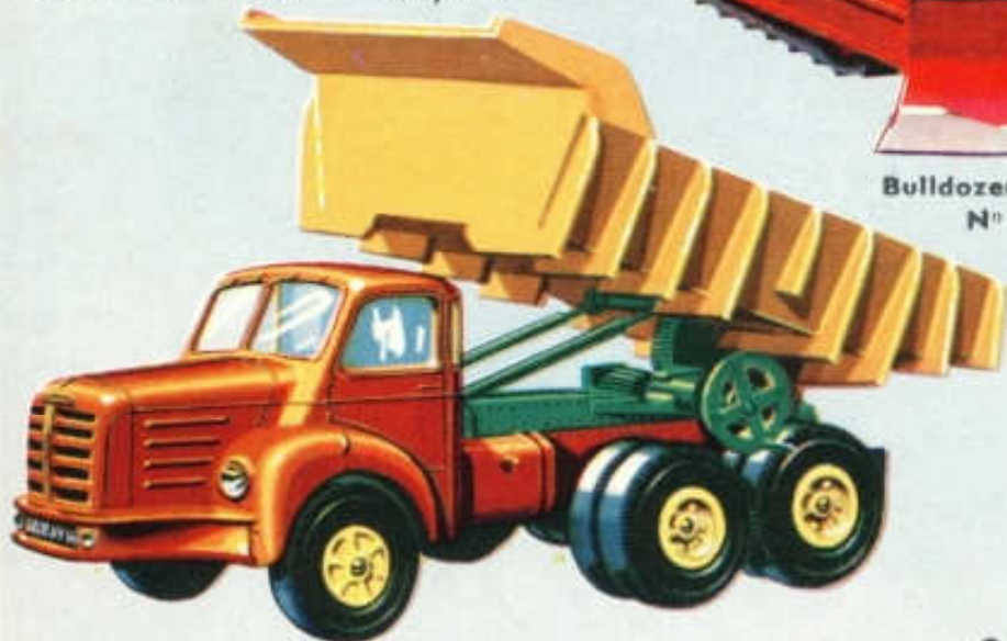
Benne Carrière Basculante sur Berliet TBO 15 - N° 113 (185 mm)... 9 F