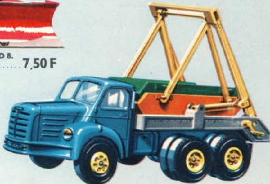
Multibenne sur Berliet TBO 15 - N° 116 (173 mm)... 9 F