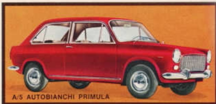
A/5 AUTOBIANCHI PRIMULA