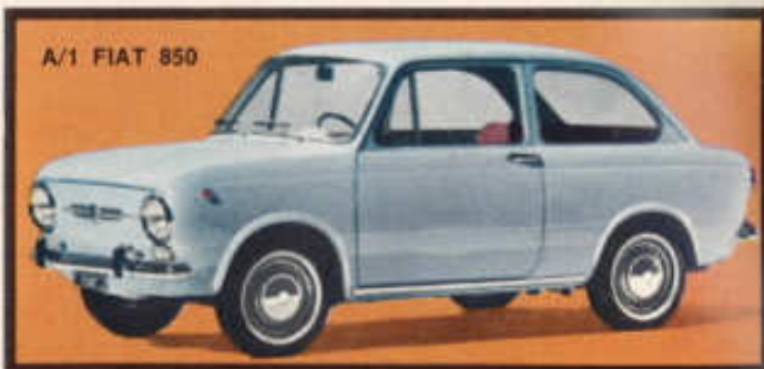
A/1 FIAT 850

Türen zu öffnen, Innenausstattung, weiche Federung, Stosstange verchromt.