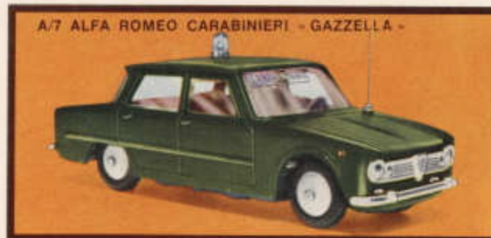
A/7 ALFA ROMEO CARABINIERI - GAZZELLA -

Öppningsbara dörrar, inredd kupé, fjädrande hjul, förkromade stötfångare.