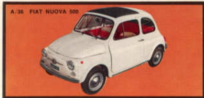
A/36 FIAT NUOVA 500

Vordere und hintere Karrosserie zu öffnen, Miniaturmotor, Türen zu öffnen, Innenausstattung, weiche Federung, Ersatzreifen.