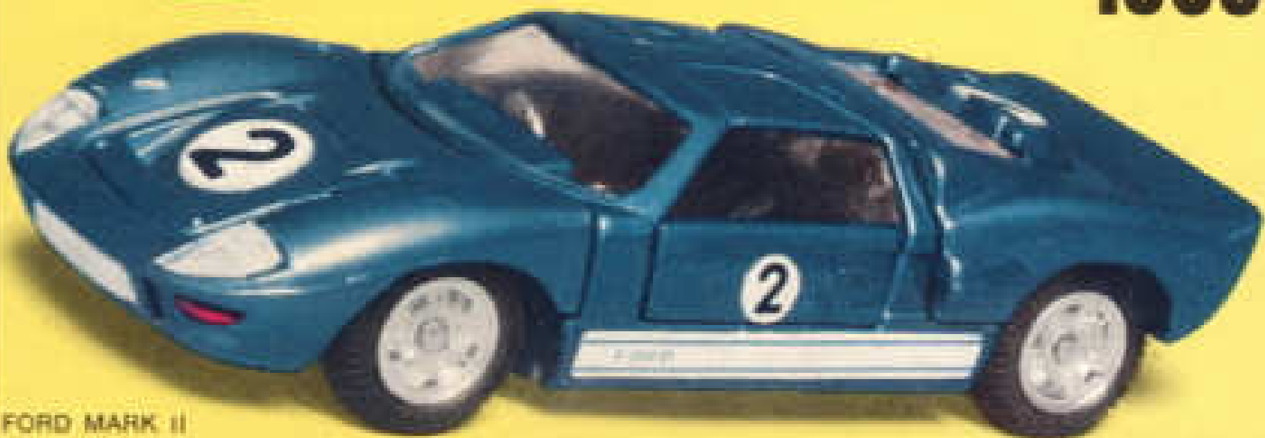
FORD MARK II