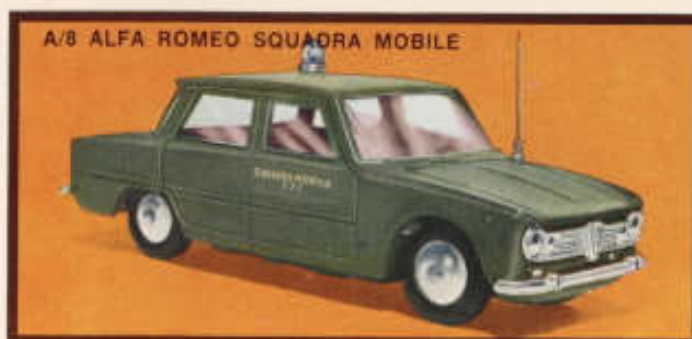
A/8 ALFA ROMEO SQUADRA MOBILE

Türen zu öffnen, Innenausstattung, weiche Federung, Stosstange verchromt, Radio-Antenne, imitierte Beleuchtung.