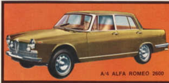
A/4 ALFA ROMEO 2600

Öppningsbara dörrar, inredd kupé, fjädrande hjul, förkromade stötfångare.