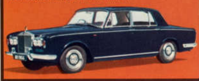
A/26 ROLLS ROYCE SILVER SHADOW