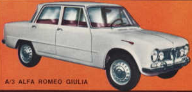
A/3 ALFA ROMEO GIULIA

Türen zu öffnen, Innenausstattung, weiche Federung, Stosstange verchromt.