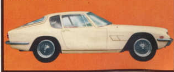
A/10 MASERATI MISTRAL