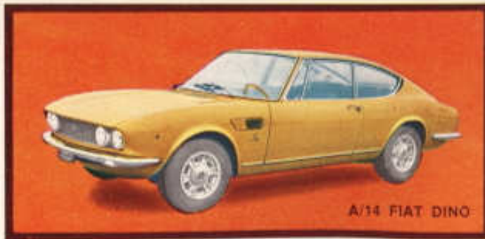
A/14 FIAT DINO