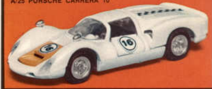
A/25 PORSCHE CARRERA 10