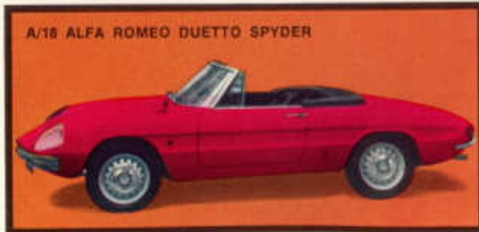
A/18 ALFA ROMEO DUETTO SPYDER