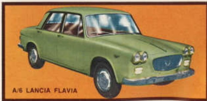
A/5 LANCIA FLAVIA

Türen zu öffnen, Innenausstattung, weiche Federung, Stosstange verchromt.