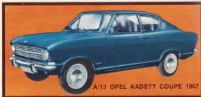
A/13 OPEL KADETT COUPÉ 1967

Öppningsbar motorhuv, inrett motorrum, öppningsbar bagagelucka, inredd kupé, fjädrande hjul, förkromade stötfångare.