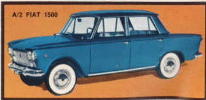
A/2 FIAT 1500

Öppningsbara dörrar, inredd kupé, fjädrande hjul, förkromade stötfångare.