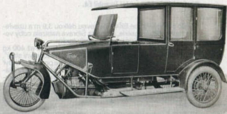
Trimobil EK 4 se měl uplatnit i jako autodrožka.

Na XV. mezinárodní automobilové výstavě v Praze (28. dubna až 6. května 1923) se publiku představily hned čtyři exempláře tříkolek Trimobil: otevřený čtyřmístný model s čalouněním anglickou kůží, elektrickým osvětlením a dvěma ochrannými skly před cestujícími vpředu i vzadu, šoféřské kupé s uzavřenou zadní částí karoserie a řízením volantem (u všech ostat-