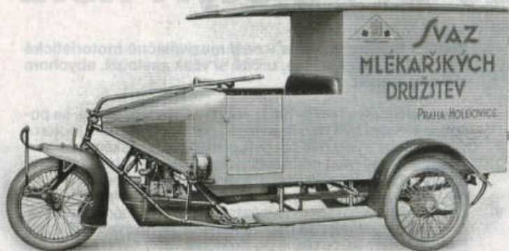
Dodávkový model Trimobil ENS z roku 1923.

4/14 HP. Čtyřmetrový vůz klasické koncepce měl opět vzduchem chlazený dvouválec, tentokrát však s protilehlými válci (flat-twin). Převodovka byla třístupňová a obě nápravy tuhé, odpružené podélnými půleliptickými listovými pery. Brzdy byly opět jen vzadu, kola - tentokrát disková - měla osvědčený rozměr 710 x 90 mm. Motor byl opatřen elektrickým spouštěčem Bosch, zapalování a osvětlení nesly tutéž značku, palivová nádrž o objemu 30 l byla připevněna na zadní stěně motorového prostoru. Čtyřsedadlová karoserie s dvířky na obou bocích měla odnímatelnou pevnou nástavbu, po její demontáži pak mohla dostat skládací plátěnou střechu a jednoduché čelní sklo.