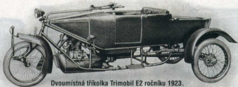
Dvoumístná tříkolka Trimobil E2 ročníku 1923.