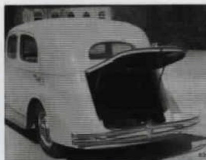
Zád sedanu Superb 640 s nahoru vyklápěcím víkem zavazadlového prostoru.