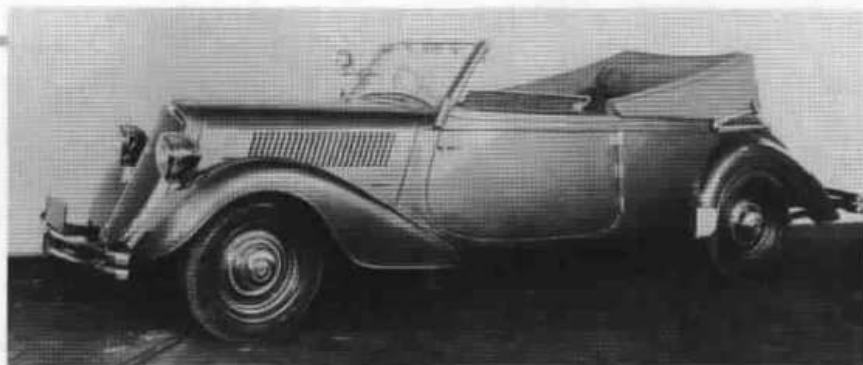
Dvoudveřový kabriolet Superb ročníku 1936 (typ 902).

Superb typu 902 se běžně prodával s uzavřenou čtyřdveřovou karoserií se čtyřmi i šesti bočními okny ve čtyřmístném a šestimístném provedení, objevil se však i coby dvoudveřový kabriolet se standardním rozvorem 3300 mm a víc než pětimetrovou délkou. Samostatnou zmínku si zaslouží sedan s prodlouženou spřávkou zadí, zakrytými zadními koly a výrazně protaženými zadními blatníky, který na zakázku karosovala vysokomýtská firma Sodomka. Kariéra typu 902 byla poměrně krátká - od