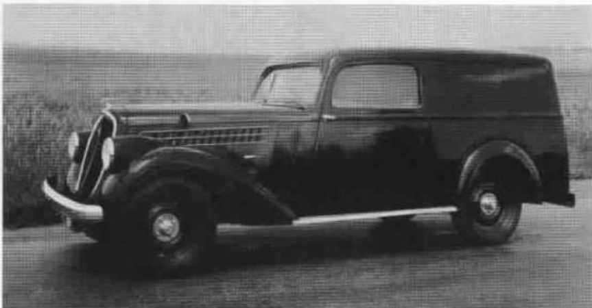
Neobvyklé zjevení: Škoda Superb ročníku 1939 karosovaná jako dodávka.