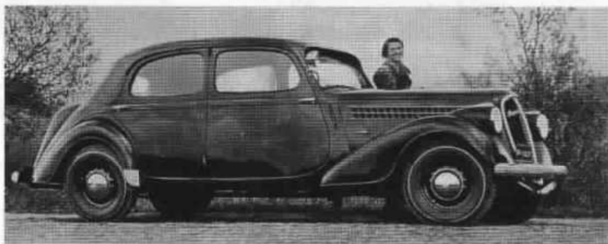
Škoda Superb (typ 913) ročníku 1937 s pětimístnou karoserií sedan.

června do října 1936 vznikla jediná série pěti desítek vozů s motorem 2,7 l.