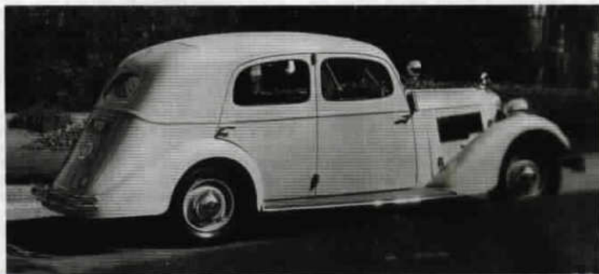
Elegantní a prostorný sedan Škoda Superb 640 z poloviny třicátých let.

Šestimístná limuzína Superb 640 se v roce 1935 prodávala za 64 900 Kč, tedy za víc než dvojnásobek ceny sedanu Rapid se čtyřválcovým motorem 1,4 l (ten tehdy stál 30 800 Kč). Byla to však částka odpovídající postavení typu