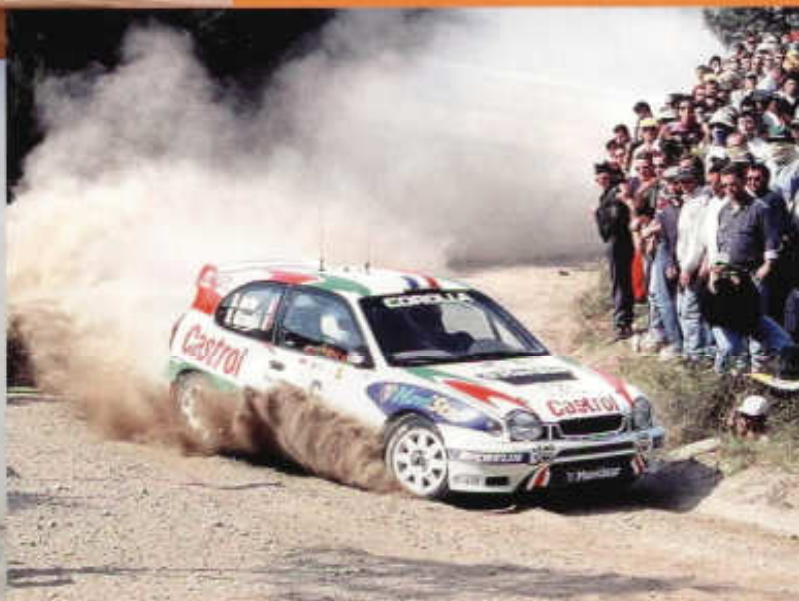
TAKHLE RADIL AURIOL S HBITOU COROLLOU WRC PŘI PORTUGALSKÉ RALLYE 1998

nila v soutěžní tým TTE (Toyota Team Europe) reprezentující japonskou značku v mistrovství světa. První vítězství v soutěži MS získal pro Toyotu Fin Hannu Mikkola, když s vozem Corolla vyhrál Rallye 1000 jezer 1975.