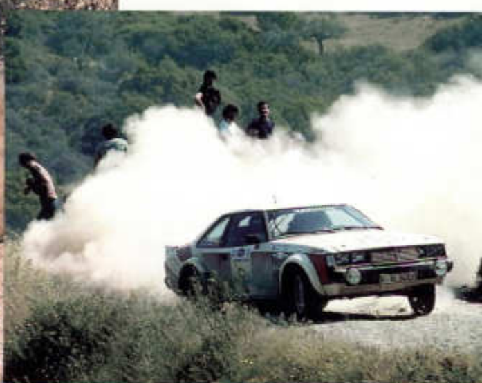
POSADKA ANDERSSON-LIDDON NA TRATI RALLYE AKROPOLIS 1980