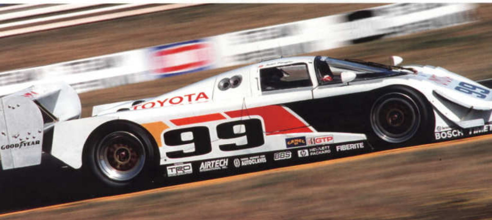
TOYOTA EAGLE MARK III, VÍTEZ AMERICKÉHO IMSA GTP V LETECH 1992 A 1993

Panasonic Toyota Racing jako jediným z týmů formule 1 vstoupil do sezony 2007 se stávajícím motorem, nezměněnou značkou pneumatik a stejnými jezdci. Nový monopost TF 107 byl ovšem zcela nový vůz. Výsledky sice zůstaly poněkud za očekáváním, ale i tak Toyota potvrdila svoji příslušnost ke světové elitě motoristického sportu. ●