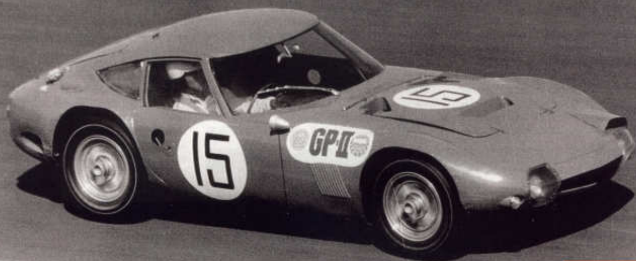
TOYOTA 2000 GT VYBOJOVALA TŘETÍ MÍSTO V ČILI GRAND PRIX JAPONSKA 1966