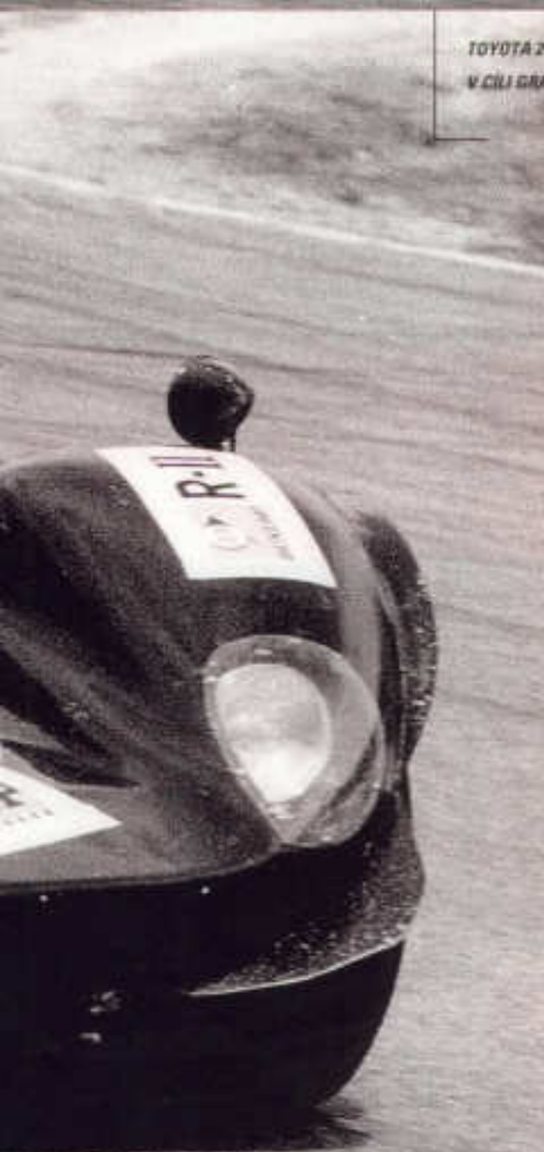
TOYOTA 700ČNÍKU 1968 S TŘILITROVÝM MOTOREM V8 PŘED ZADNÍ NÁPRAVOU

Vše začalo v létě 1957. Toyota se tehdy jako jediná japonská automobilka přihlásila k účasti v mimořádně náročné automobilové soutěži kolem Austrálie. 21. srpna 1957 se na startu v Melbourne objevili sedan Toyota Crown se dvěma továrními řidiči a australským navigátorem. Devatenáctdenní klání dlouhé přes šestnáct tisíc kilometrů, jehož trať vedla po prašných, kamenitých a blátivých cestách s necestách, Crown úspěšně absolvoval, a ani nebezpečně vyhlížející kolize s kloukáním mu nezabránila dorazit 10. září do cíle, opět v Melbourne. O rok později se vozy Toyota osvědčily při podobné soutěži v Japonsku a rozepsaly tak další kapitolu sportovních aktivit své značky.