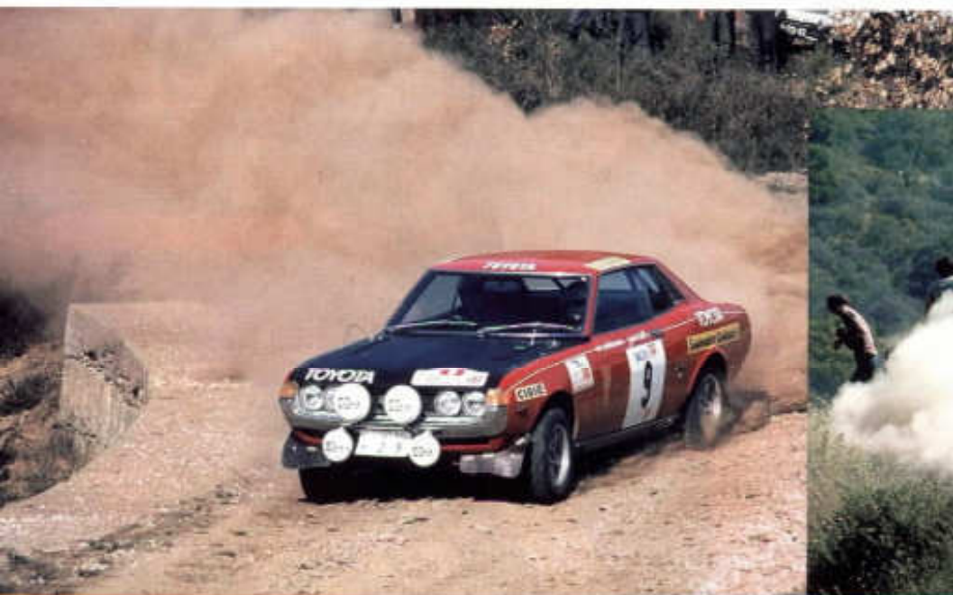
OVE ANDERSSON S VÖZEM CELICA 1600 PŘI PORTUGALSKÉ RALLYE 1972

Jejím protagonistou se stal v první polovině sedmdesátých let švédský soutěžní jezdec Ove Andersson. V závěru sezony 1972 startoval v britské RAC Rally s vozem Toyota Celica 1600, celkově vybojoval deváté místo a vyhrál svoji třetí. V následujících dvou letech Andersson absolvoval s Celicí řadu evropských soutěží a v roce 1975 založil v Bruselu společnost Andersson Motorsport, jež se o čtyři roky později po přestěhování do Kolína nad Rýnem promě-