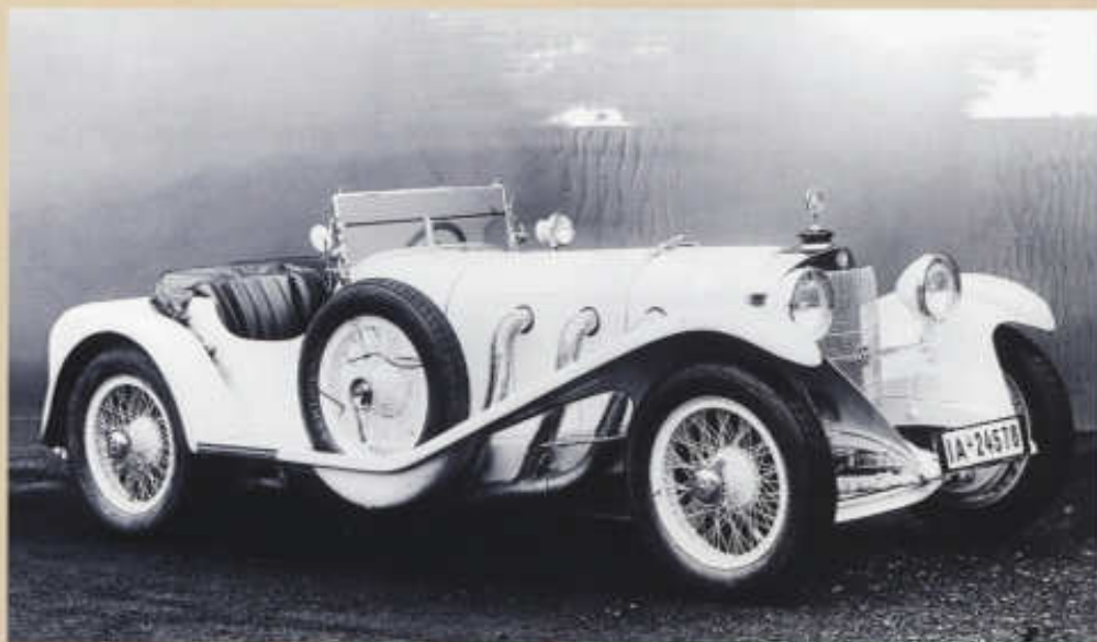
Mercedes-Benz SSK ročníku 1930 se šestiválcem 7,1 l s kompresorem Roots