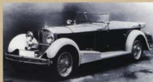
⌘ Sportovní Mercedes SS s otevřenou čtyřmístnou karosérií z roku 1931