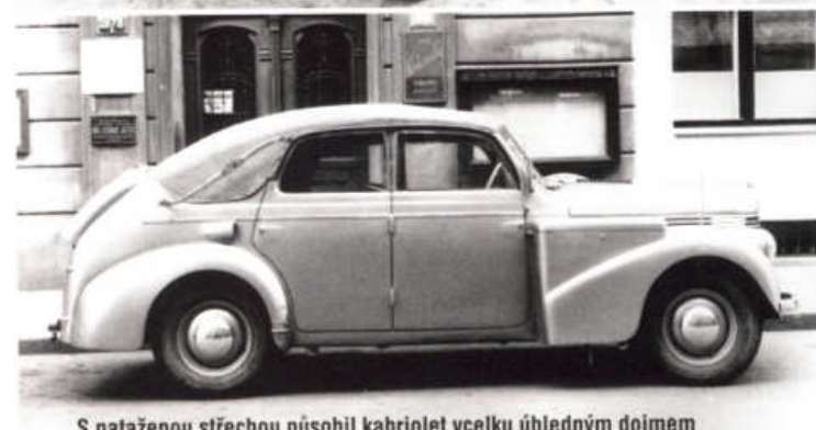
S nataženou střechou působil kabriolet vcelku úhledným dojmem