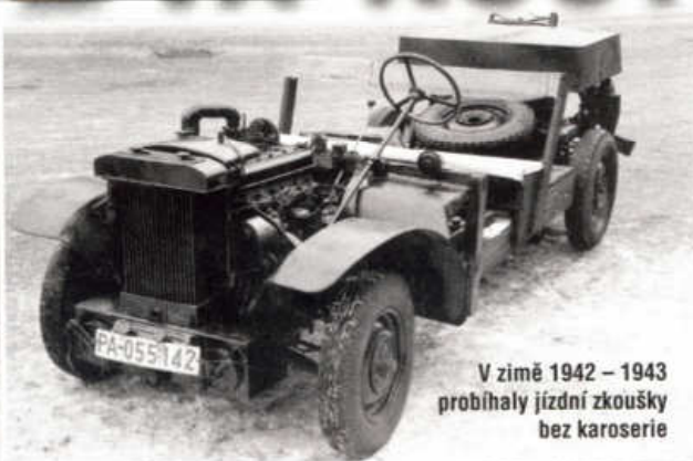
V zimě 1942 – 1943 probíhaly jízdní zkoušky bez karoserie