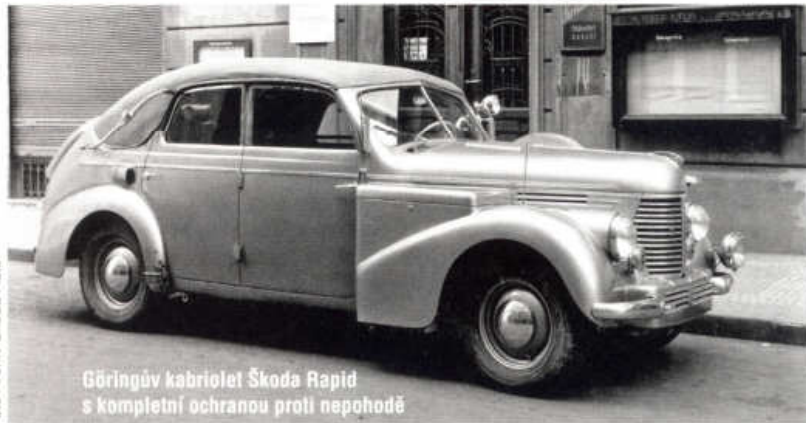
Göringův kabriolet Škoda Rapid s kompletní ochranou proti nepohodě

Druhý automobil Škoda Rapid na plynový pohon pro Alberta Göringa ▼