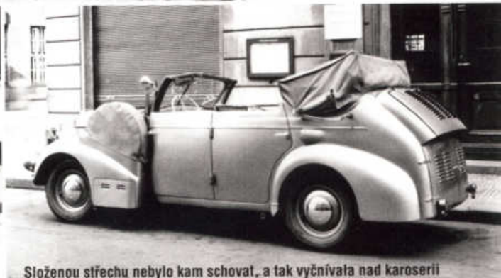
Složenou střechu nebylo kam schovat, a tak vyčnívala nad karoserií