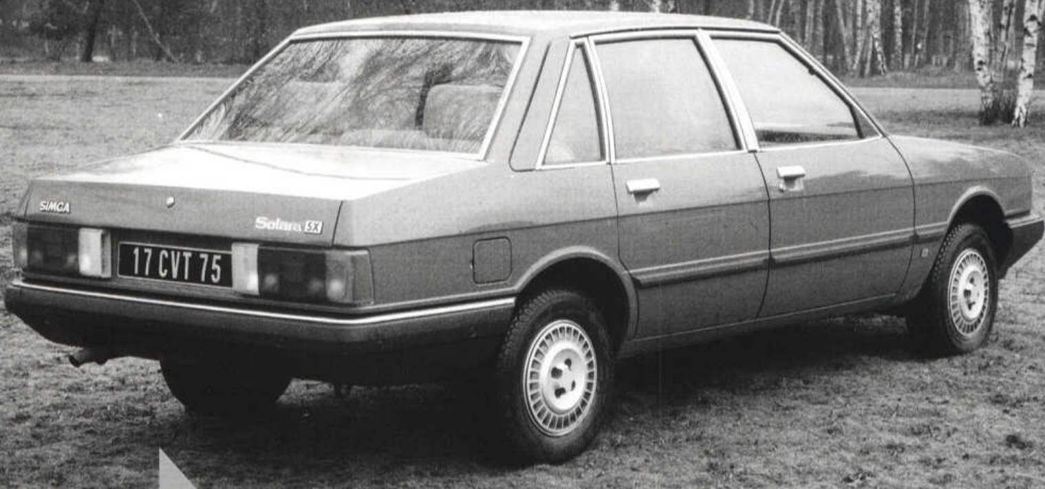
První Solara nesla ještě vlevo na zádi nápis Simca

► Simca 1307 GLS měla motor 1294 cm 3 o výkonu 68 k (50 kW), dražší model 1307 S poháněl tentýž čtyřválec, jenž se dvěma dvojitými karburátory dával 82 k (60 kW). Simca 1308 GT dostala pod kapotu větší čtyřválec 1442 cm 3 naladěný na 85 k (63 kW).