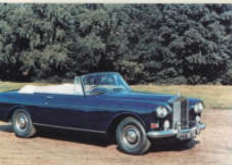
Zakázkový kabriolet od firmy H.J. Mulliner na podvozku Silver Cloud ročníku 1958

ni masku Bentley. Od roku 1961 pak spojením již zmíněných firem vznikla karosářská divize Mulliner Park Ward, jež během následujících třiceti let oblě-