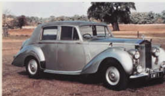
První Rolls-Royce dodávaný s kompletní celokovovou karosáří: Silver Dawn z let 1949 ať 1955

listová pera, kapalinou chlazený řadový šestiválec 4257 cm 3 uděloval pětimetrovému automobilu o hmotnosti kolem 2100 kg největší rychlost 135 km/h. Od roku 1951 se vyráběl Silver Wraith s motorem převrtaným na 4566 cm 3 a podvozkem s rozšířeným rozchodem