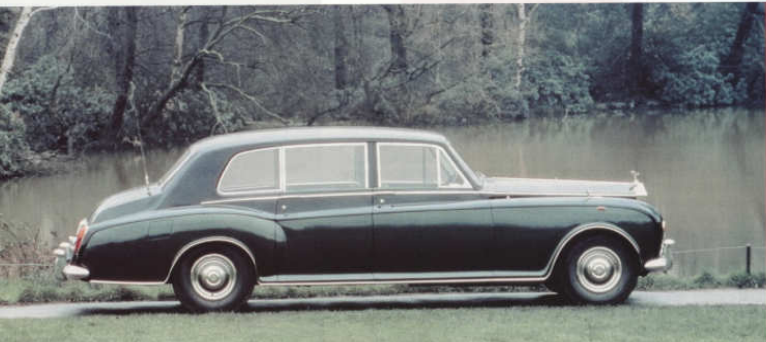
Sest metrů luxusu: impozantní Rolls-Royce Phantom VI na snímku z poloviny 70. let

ver Cloud. Do vínku dostal zcela nový robustní podvozek s rámem opatřeným šikmými výtuhami ve tvaru X a standardním rozvorem 3,12 m. Nezávisle zavěšená přední kola byla odpružena vnutnými pružinami, tuhá zadní náprava listovými pery, přičemž vpředu i vzadu se montoval příčný stabilizátor. Nový vůz jezdil na patnáctipalcových kolech, zatímco jeho předchůdci měli kola o jeden až dva palce větší. Výrobce nabízel Silver Cloud jako 5,4 m dlouhý čtyřdveřový sedan s karoserií, kterou dodávala firma Pressed Steel, finální montáž a vyzdobení však probíhaly v mateřské automobilce. Srdcem vozu byl řadový šestiválec 4887 cm 3 , jenž mu spolu se čtyřstupňovou samočinnou převodovkou uděloval největší rychlost 165 km/h. Standardní podvozek stejně jako dražší verze s rozvorem prodlouženým na 3,23 m se dodávaly i samostatně a karosovaly je renomované firmy Hooper, James Young, H.J. Mulliner, ale také filiálka R-R, Park Ward.