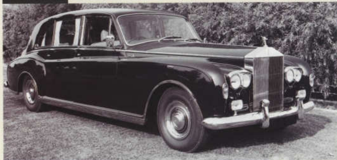
V této podobě se impozantní limuzína Phantom VI vyráběla až do roku 1991

Novou éru zahájil Rolls-Royce Silver Shadow představený v říjnu 1965 na pařížském autosalonu. Pod moderní samonosnou karoserií se stupňovitou zádi ukrýval zcela nový podvozek s nezávislým zavěšením zadních kol a kotoučovými brzdami vpředu i vzadu. Motor V8 o objemu 6230 cm 3 byl opět spojen se čtyřstupňovou samočinnou převodovkou, novinkou bylo samočinné seřizování světlé výšky nad vozovkou, na něž si britská automobilka – stejně jako na >>