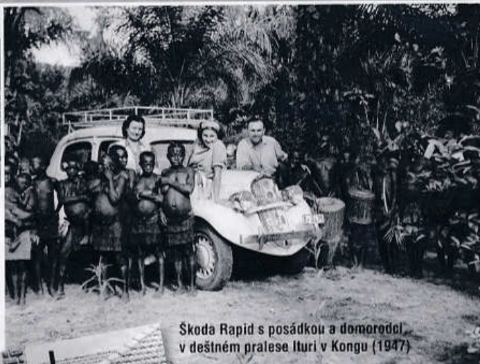
Škoda Rapid s posádkou a domorodci v deštivém pralesi Ituri v Kongu (1947)

▼ Nairobi 1949: vlevo Standard Vanguard, uprostřed Rapid a vpravo Mercury V8