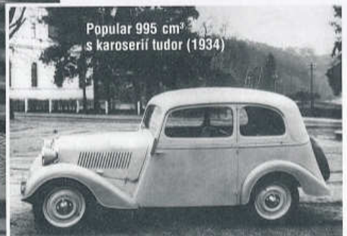
Popular 995 cm 3 s karoserií tudor (1934)