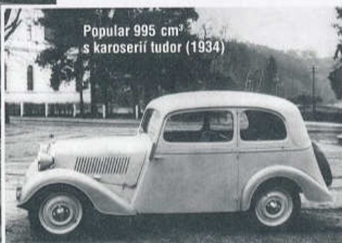
Popular 995 cm 3 s karoserií tudor (1934)