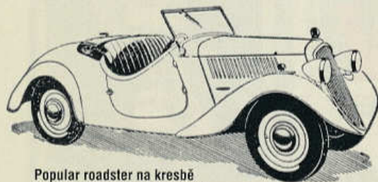
Popular roadster na kresbě z dobového prospektu (1935)

Dodávkový vůz s užitečnou hmotností 300 kg (1935)