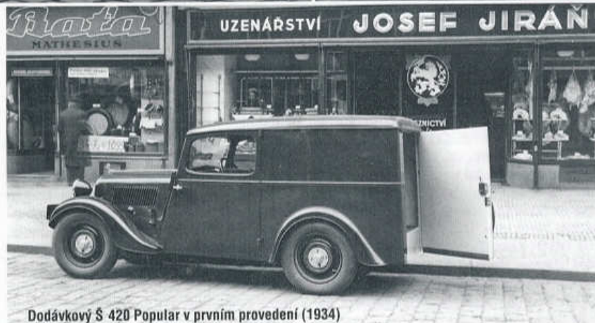
Dodávkový S 420 Popular v prvním provedení (1934)

V období přetrvávající odbytové krize hledaly československé automobilky záchranu v cenově dostupných vozech pro širší okruh motoristů. Často používaný výraz lidový vůz je však nadsázkou, protože i nejlevnější automobily na tuzemském trhu byly v té době dostupné jen středním vrstvám. V Mladé Boleslavi vyráběli od roku 1933 kompaktní typ Škoda 420 se čtyřválcem SV 995 cm 3 , třístupňovou převodovkou v bloku s motorem, páteřovým rámem tvořeným hranatým ocelovým profilem a tuhou přední nápravou nesenou dvojicí čtvrteliptických listových per. Popular se od svého staršího sourozence