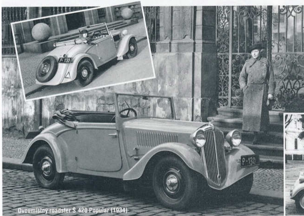
Dvoumístný roadster S 420 Popular (1934)

patřila k nejslavnějším automobilovým závodnicím minulého století, vyrovnala se mužům zvoucých jmen jako byli Campari, Divo, Dreyfus a další, kteří ve dvacátých letech znamenali totéž, co dnes Alonso, Hamilton či Webber. 16. listopadu uplyne 110 let od jejího narození; zemřela 5. ledna 1994 v Praze.