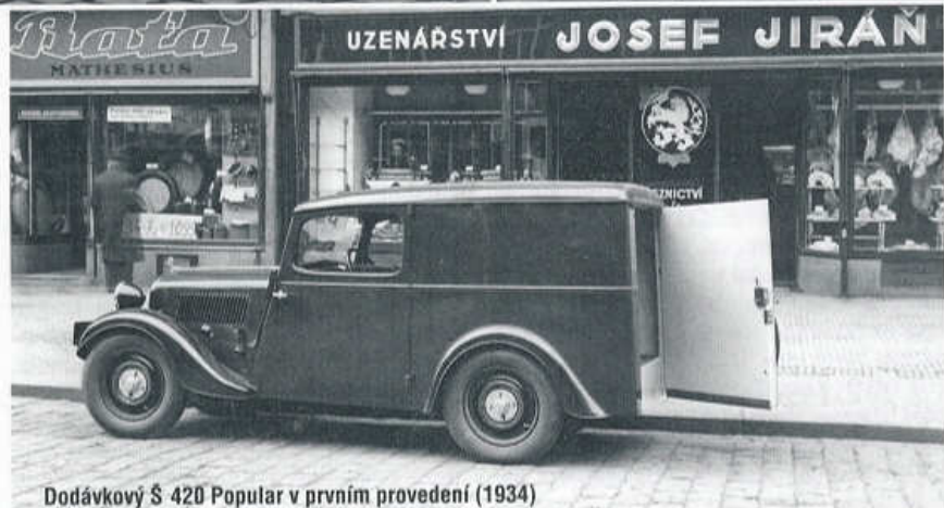
Dodávkový S 420 Popular v prvním provedení (1934)

V období přetrvávající odbytové krize hledaly československé automobilky záchranu v cenově dostupných vozech pro širší okruh motoristů. Často používaný výraz lidový vůz je však nadsázkou, protože i nejlevnější automobily na tuzemském trhu byly v té době dostupné jen středním vrstvám. V Mladé Boleslavi vyráběli od roku 1933 kompaktní typ Škoda 420 se čtyřválcem SV 995 cm 3 , třístupňovou převodovkou v bloku s motorem, páteřovým rámem tvořeným hranatým ocelovým profilem a tuhou přední nápravou nesenou dvojicí čtvrteliptických listových per. Popular se od svého staršího sourozence