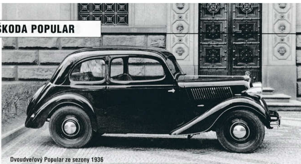
Dvoudveřový Popular ze sezony 1936