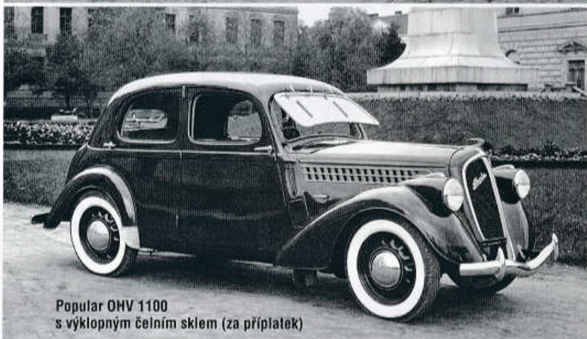
Popular OHV 1100 s výklopným čelním sklem (za příplatek)