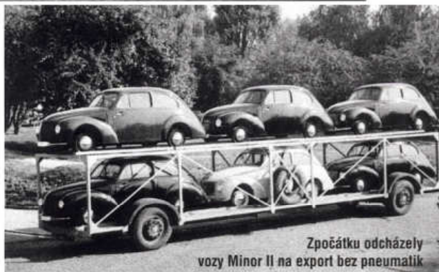
Zpočátku odcházely vozy Minor II na export bez pneumatik

přední nápravou uložený řadový dvoudobý dvouválec 616cm 3 o výkonu 20 k (15kW)/3500 min -1 , na nějž dozařadila navazovala rozvodovka a čtyřstupňová převodovka. Chladič byl za motorem, za ním měla své místo palivová nádrž o objemu 25 litrů. V tuzemsku výrobce doporučoval směs oleje a benzínu 1:25, v prospektech pro zahraničí je uváděno 1:30. Převodovka ovládaná pákou na palubní desce měla trojku jako přímý záběr, zatímco čtyřka plnila funkci rychloběhu (0,8). Řízení bylo hříbenové, bubnové brzdy měly kapalinové ovládání. Vůz jezdil na kolech připevněných pěti šrouby a obutých do pneumatik 4,75 x 16. Při rozvoru 2300mm a rozchodu kol 1120/1120mm byl s uzavřenou dvoudveřovou karoserií dlouhý 4040mm, široký 1420mm a vysoký 1460mm. Zavazadlový prostor ve splývající zádi přístupný odklápěcím víkem měl objem asi 250 litrů. Karoserie byla smíšené stavby s dřevěnou kostrou a panely z ocelového plechu, její výroba vyžadovala značný podíl ruční práce. Z pohotovosti