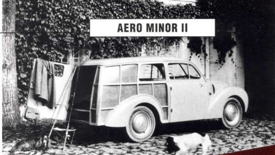
Idylka na dvoře: Aero Minor II jako kombi ve stylu woody