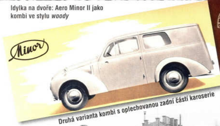
Druhá varianta kombi s oplechovanou zadní částí karoserie