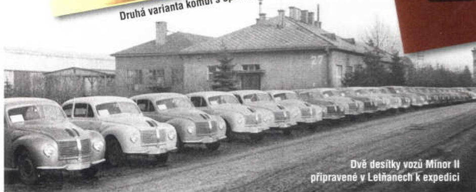
Dvě desítky vozů Minor II připravené v Letňanech k expedici

přední nápravou uložený řadový dvoudobý dvouválec 616cm 3 o výkonu 20 k (15kW)/3500 min -1 , na nějž dozařadila navazovala rozvodovka a čtyřstupňová převodovka. Chladič byl za motorem, za ním měla své místo palivová nádrž o objemu 25 litrů. V tuzemsku výrobce doporučoval směs oleje a benzínu 1:25, v prospektech pro zahraničí je uváděno 1:30. Převodovka ovládaná pákou na palubní desce měla trojku jako přímý záběr, zatímco čtyřka plnila funkci rychloběhu (0,8). Řízení bylo hříbenové, bubnové brzdy měly kapalinové ovládání. Vůz jezdil na kolech připevněných pěti šrouby a obutých do pneumatik 4,75 x 16. Při rozvoru 2300mm a rozchodu kol 1120/1120mm byl s uzavřenou dvoudveřovou karoserií dlouhý 4040mm, široký 1420mm a vysoký 1460mm. Zavazadlový prostor ve splývající zádi přístupný odklápěcím víkem měl objem asi 250 litrů. Karoserie byla smíšené stavby s dřevěnou kostrou a panely z ocelového plechu, její výroba vyžadovala značný podíl ruční práce. Z pohotovosti