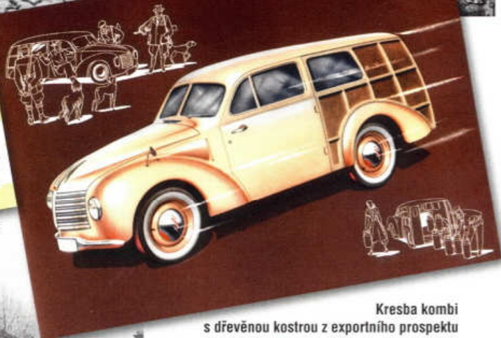
Kresba kombi s dřevěnou kostrou z exportního prospektu