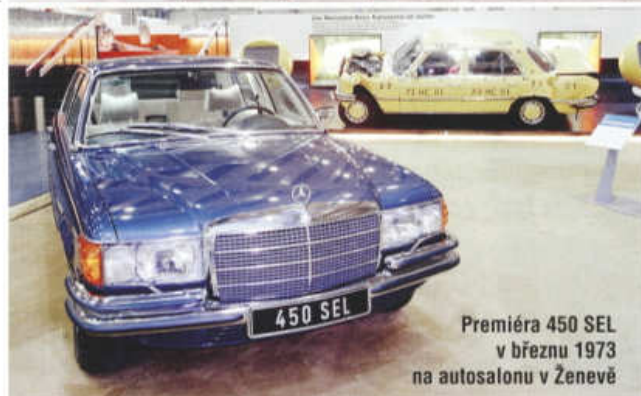
Premiéra 450 SEL v březnu 1973 na autosalonu v Ženevě

dvou, ale také čtyřstupňovou samočinnou. Model 350 SE dostal motor OHC 3499 cm 3 V8 se vstřikováním paliva, který poskytoval 200 k (147 kW) a mohl být spojen se čtyřstupňovou manuální nebo třístupňovou samočinnou převodovkou. Vozy klasické koncepce měly poháněná zadní kola nezávisle zavěšená na vlečených trojúhelníkových ramenech se šikmou osou kývání. Přední náprava s dvojicí příčných ramen,