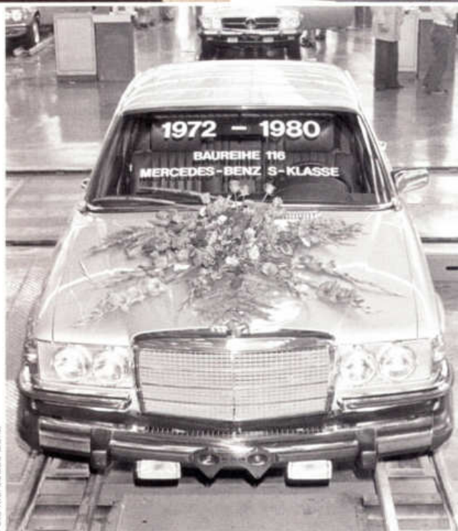
Poslední vůz řady W116 byl vyroben počátkem srpna 1980

Pro milovníky detailů připomeňme, že na přelomu let 1975 a 1976 došlo v rámci omezení množství škodlivin ve výfukových plynech k přechodu z elektronického vstřikování Bosch D-Jetronic na mechanické Bosch