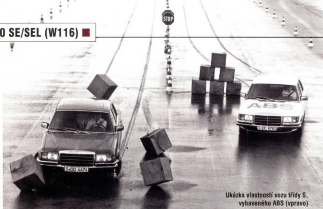
Ukázka vlastností vozu třídy S, vybaveného ABS (vpravo)