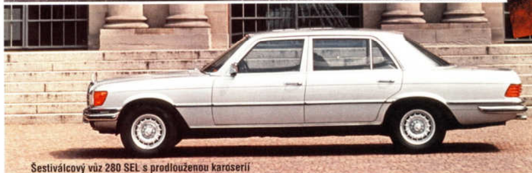
Šestiválcový vůz 280 SEL s prodlouženou karoserií

▼ Prostor zadních sedadel prodlouženého 450 SEL