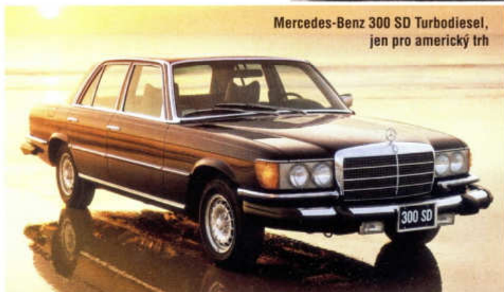
Mercedes-Benz 300 SD Turbodiesel, jen pro americký trh