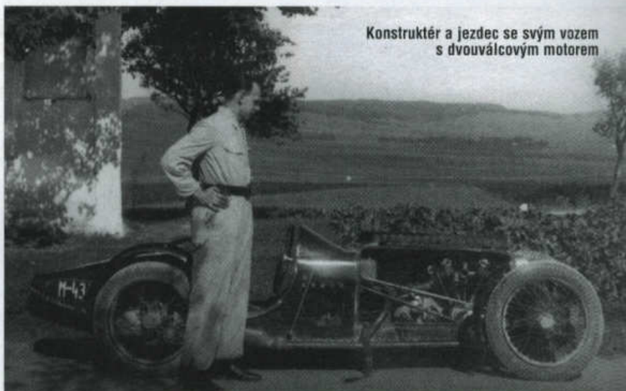
Konstruktér a jezdec se svým vozem s dvouválcovým motorem