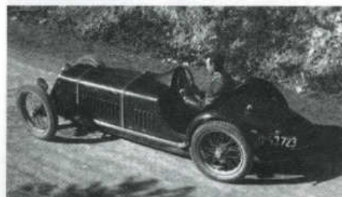
Sportovní karoserie od firmy Wikov se vyznačovala špičatou záďí

Cotton motor i převodovku, aby získal poháněcí ústrojí pro budoucí automobil. O letních prázdninách roku 1932 byl hotov podvozek a ještě bez karoserie s ním jeho tvůrce uskutečnil řadu zkušebních jízd. Před koncem roku 1932 byla na