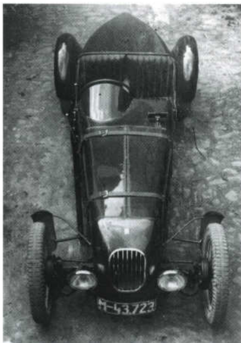
Juja v přepracovaném provedení působila modernějším dojmem