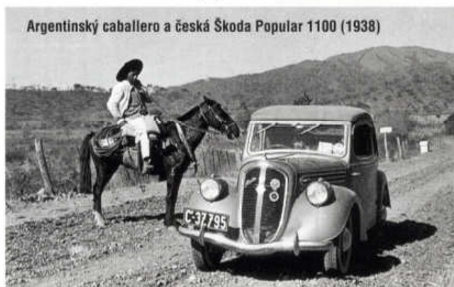
Argentinský caballero a česká Škoda Popular 1100 (1938)