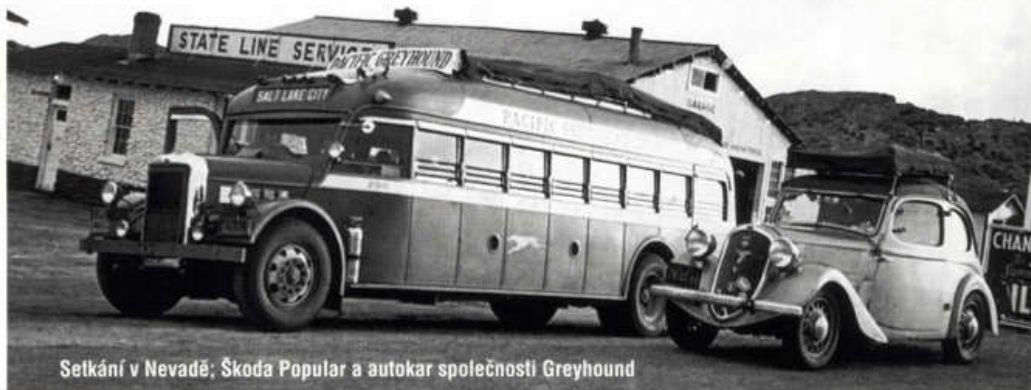
Setkání v Nevadě; Škoda Popular a autokar společnosti Greyhound