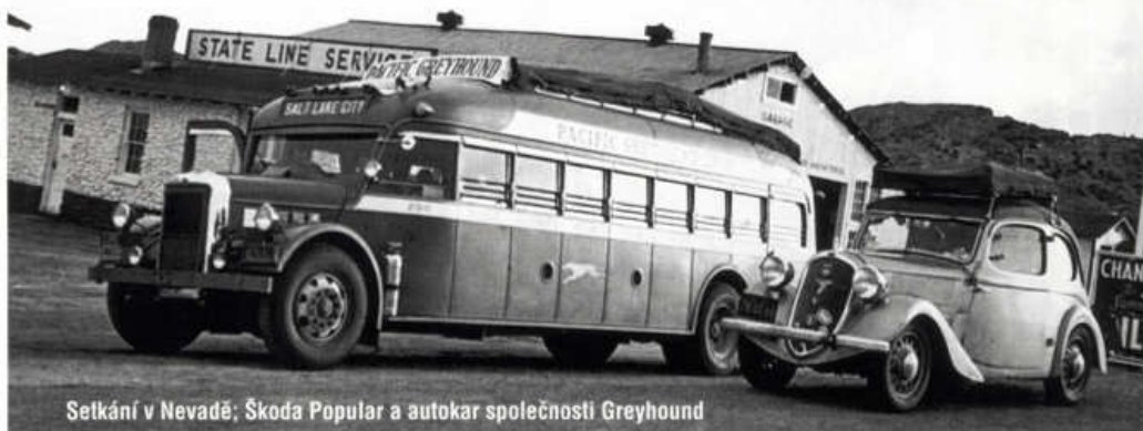
Setkání v Nevadě; Škoda Popular a autokar společnosti Greyhound