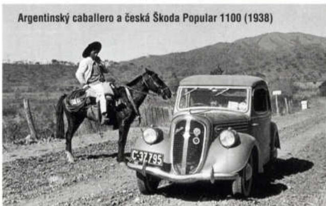
Argentinský caballero a česká Škoda Popular 1100 (1938)