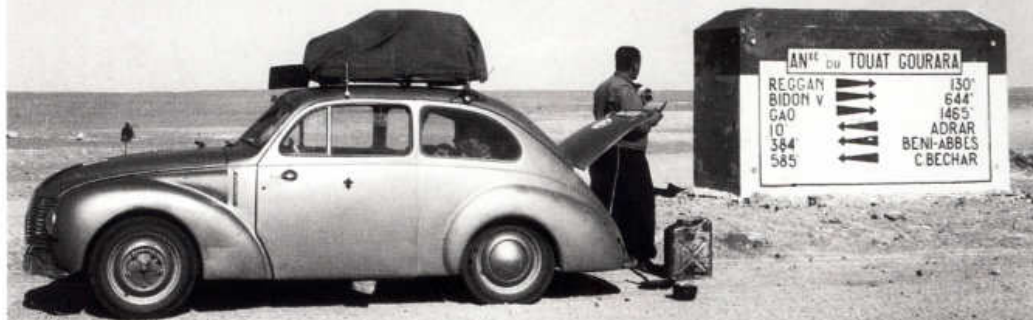
Aero Minor na Saahaře, jen deset kilometrů před alžírským Adrarem