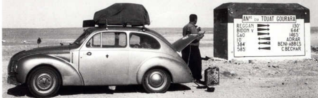
Aero Minor na Sahaře, jen deset kilometrů před alžírským Adrarem