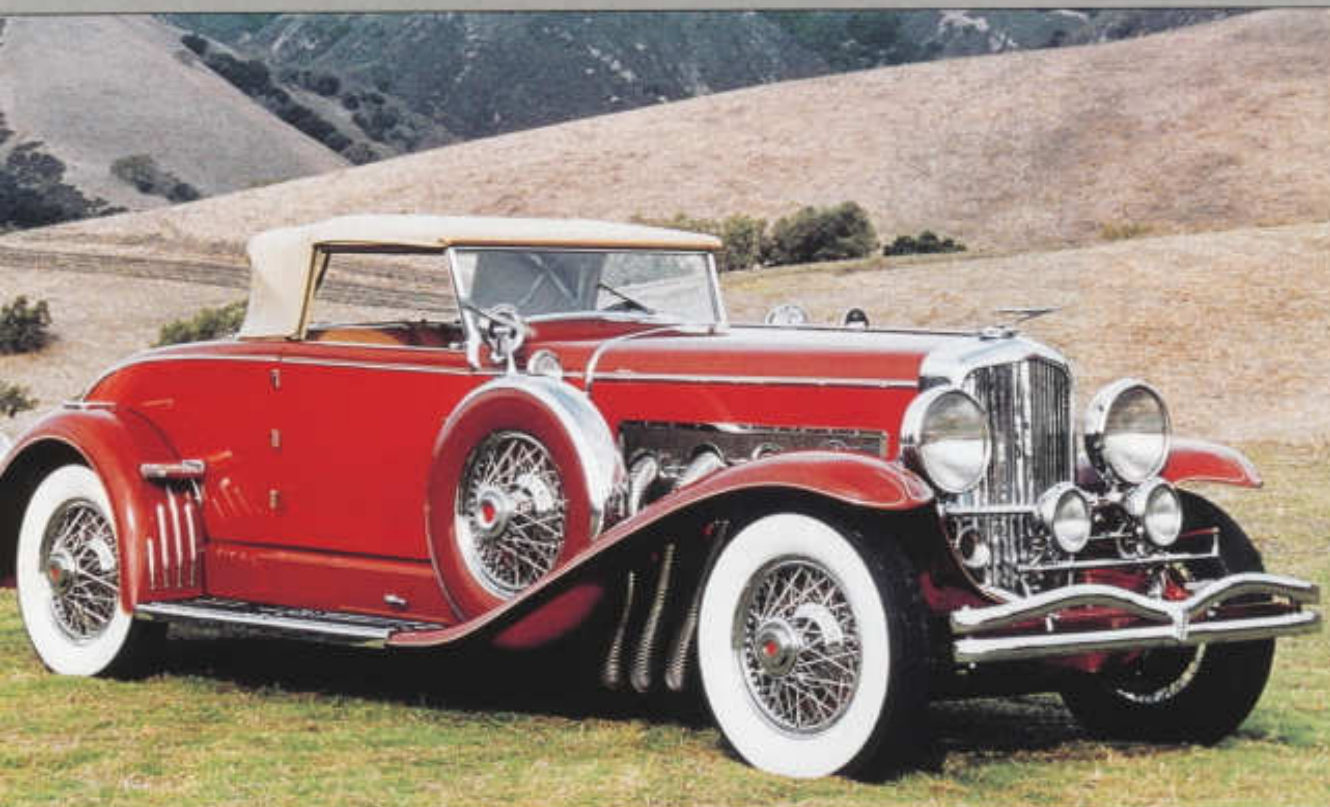
Duesenberg SJ jako klasický roadster s karoserií Murphy