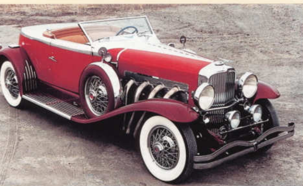
Sportovní roadster SJ se šikým čelním sklem a členovitou záďí

rychlíostních rekordů pro automobily poháněné motory o objemu 5 až 8 l, včetně hodinového průměru 244,80 km/h a čtyřadvacetihodinového 217,97 km/h. Během následujících dvou let pak další rekordy zaznamenal s tímto vozem, ale vybaveným leteckým motorem Curtis Conqueror, na jehož vestavbě opět pracoval Augie Duesenberg. V roce 1937 se Mormon Meteor proměnil zpátky v poměrně civilizovaný sportovní automobil, pod jeho kapotu se vrátil přeplňovaný osmiválec Duesenberg SJ. Jenkins a jeho syn vůz používali dalších