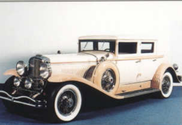
Elegantní sedan Duesenberg J ročníku 1930 s karoserií Durham

módním stylu a výrazně zaoblenými blatníky, z nichž přední navíc ukryvaly náhradní kola pod aerodynamickými kryty. Koncem třicátých let pak v karosárně Bohman a Schwartz na přání zákazníků modernizovali několik dalších vozů Duesenberg, žádný však už nekarosovali celý.