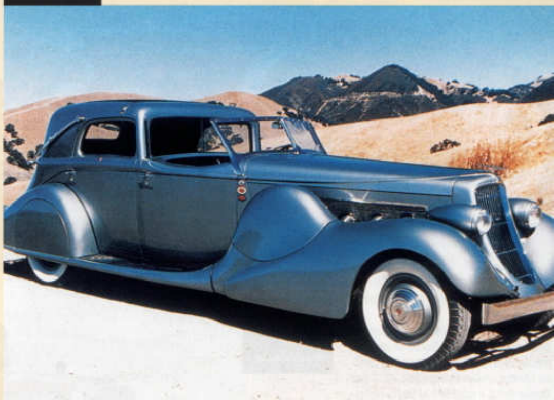
Town Car typu SJ z roku 1935 s karoserií Bohman a Schwartz

Srdcem impozantního automobilu se stal řadový osmiválec se čtyřmi ventily pro každý válec a dvěma vačkovými hřídeli v hlavě poháněnými řetězem (rozvod 2 x OHC), jehož výrobu Cord svěřil jedné ze svých akvizic, letecké továrně Lycoming. Osmiválec o objemu 6,9 l dával výkon 265 k (195 kW) a spolu s třístupňovou převodovkou uděloval vozu o hmotnosti 2400 až 3200 kg největší rychlost 180 až 190 km/h, přičemž sportovně střížený pětimetrový model s kratším rozvorem 3,62 m dokázal zrychlit z 0 na 130 km/h za necelých 23 s. I sedmimístné modely s delším rozvorem 3,9 m a bezmála šestimetrovou délkou však vykazovaly na svoji dobu fantastické jízdní výkony a na amerických silnicích neměly srovnatelného konkurenta.