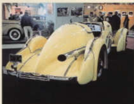
Zář vazu Mormon Meteor připomíná loďní styl roadsterů SJ

pět let v běžném provozu a najezdil s ním přes 20 tisíc mil (32 tisíc km).