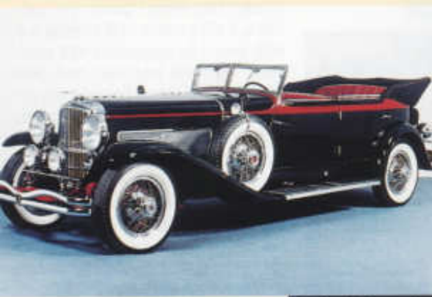
Čtyřveňový faeton Duesenberg J z roku 1931 s karoserií Dietrich