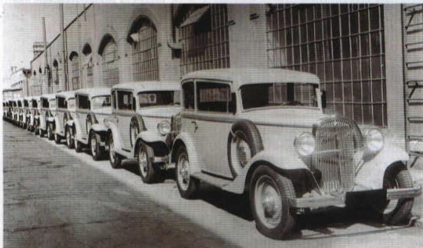
Vozy Walter Junior v inovované podobě (nová maska, šikmé čelní sklo) připravené k expedici z výrobního závodu v Praze-Jinonicích.

V letech 1932 a 1933 se v důsledku hospodářské krize nekonal Pražský autosalon, a tak měl Walter Junior výstavní premiéru až v dubnu 1934. Představil se s lehce modernizovanou karoserií s mírně sešikmeným čelním sklem a novou maskou, přičemž výkon motoru díky zvýšenému stupni komprese lehce stoupl na 24 k (18 kW). Na rozdíl od svého italského sourozence si Junior zachoval třístupňovou převodovku (Fiat 508 Balilla měl od jara 1934 čtyři rychlostní stupně).