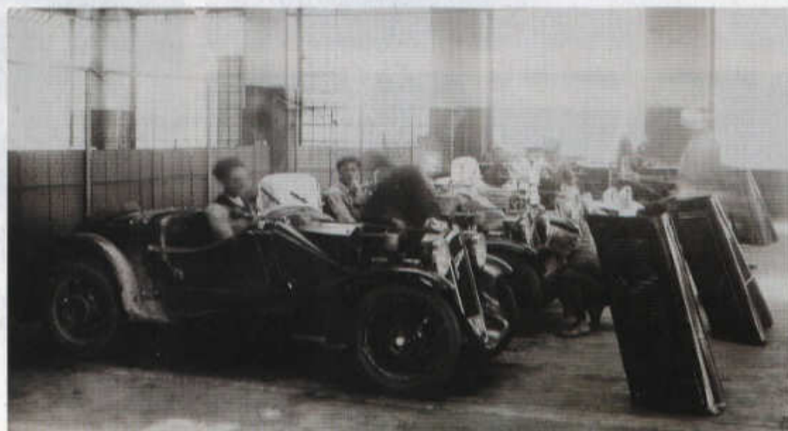
Pohled do dílny, v níž se připravovaly tovární vozy pro závod 1000 mil československých.

Automobily Walter Junior se vyráběly poměrně krátce, jen do roku 1936. Celkem vzniklo něco přes tisíc exemplářů těchto licenčních vozů, nabízených za rozumné ceny (uzavřený dvoudveřový Junior stál 27 500 Kč, kabriolet 32 500 Kč). V období odbytové krize poněkud oživily československý automobilový trh, proti domácí konkurenci, zejména vozům Škoda Popular, Praga Baby a Tatra 57, se však prosazovaly jen těžko. Souviselo to samozřejmě i s tím, že od poloviny 30. let automobilová produkce značky Walter jen doznívala, jasnou prioritu dostala letecká výroba. ■