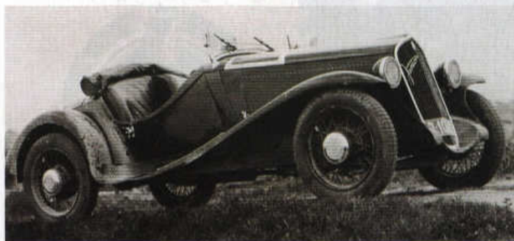
Ital s českým jménem: sportovní roadster Walter Junior S.