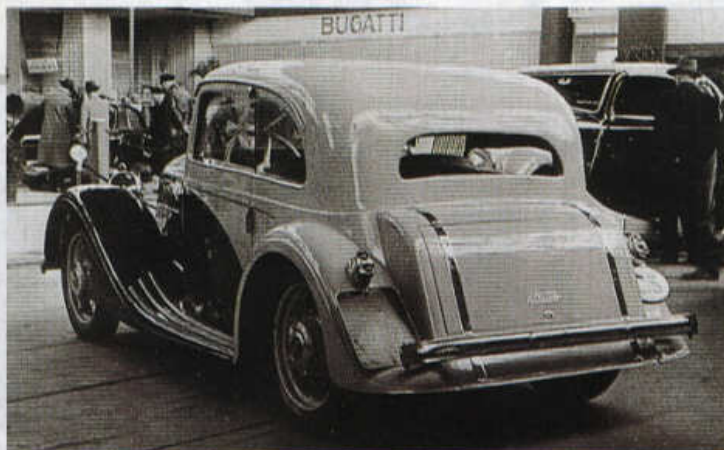
Sodomkovo kupé Junior S na drátových kolech nemělo střední sloupky karoserie.