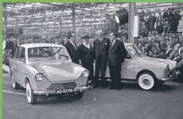
Daf 600 De Luxe při premiéře na autosalonu v Amsterdamu v únoru 1958

První prospekt vozu Daf 600, vydaný v roce 1958 pro nizozemský trh