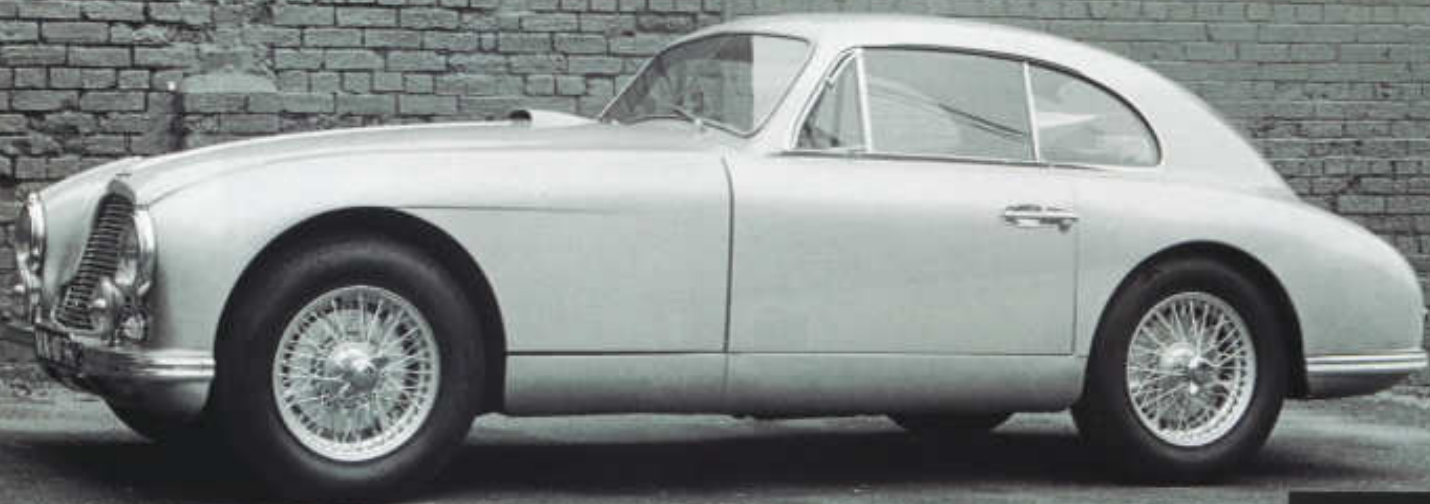
Původní dvoumístné kupé DB 2 vyráběné v letech 1950 až 1953