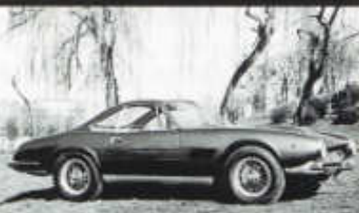
DB 4 GT Jet s karosérií Bertone z roku 1961