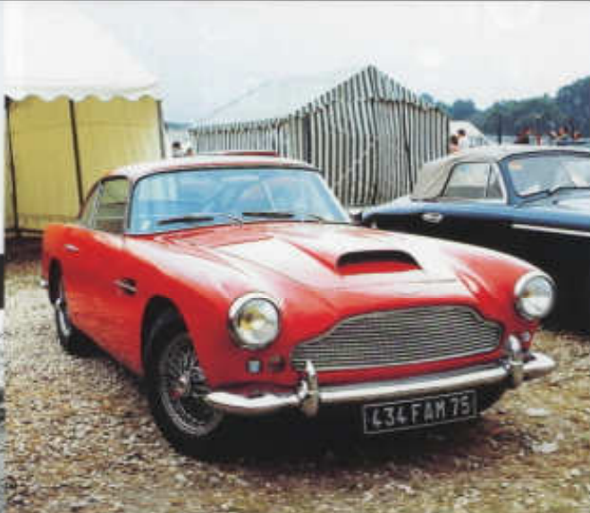
Aston Martin DB 4 se standardní přídi s klasicky umístěnými světlomety

vyznačoval neděleným panoramatickým čelním sklem, zvýšenou střešou a robustnějšími nárazníky. Zpočátku převzal obě verze motoru 2,6 l, od léta 1954 se však začal montovat šestiválec převrtaný na 2,9 l, který už ve standardní verzi dával 140 k (103 kW) a uděloval kupé rychlost až 190 km/h. V roce 1954 koupil David Brown karosárnu Tickford v Newport Pagnell v buckinghamském hrabství, která již dříve oblékala jeho automobily. O necelých pět let později se tam z Felthamu přestěhovala kompletní výroba automobilů Aston Martin, ale k tomu se ještě dostaneme.