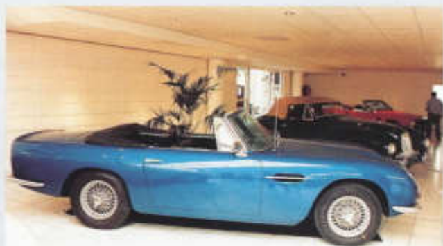
Kabriolet DB 6 Volante první série se vyráběl v letech 1966 až 1969

V říjnu 1959 debutoval sportovněji laděný Aston Martin DB 4 GT s rozvorem zkráceným na 2,36 m, celkovou délkou 4,35 m a odlehčenou karoserií, jehož šestiválec se třemi dvojitými karburátory Weber nabízel výkon 302 k (222 kW), takže s ním kupé uhánělo přes 240 km/h. Od svých relativně slabších sourozenců se model DB 4 GT na první pohled odlišoval světlomety zapuštěnými do blatníků a opatřenými aerodynamickými kryty z organického skla. O rok později, v říjnu 1960, se představil další krasavec: DB 4 GT Zagato, aerodynamické kupé s karoserií italské proveniencie a motorem naladěným na 314 k (231 kW). Dvě desítky podvozků DB 4 GT putovaly do Milána, prokazatelně spatřilo světlo světa 19 automobilů v tomto provedení. Jeden podvozek DB 4 GT putoval koncem ro-