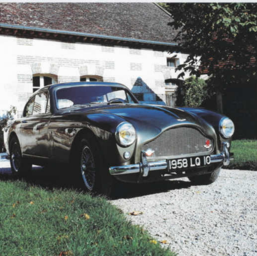
Aston Martin DB Mk III – vůz třetí série řady DB 2/4 z roku 1958

v roce 1949, jeho malosériová výroba se však začala rozbíhat až na jaře 1950. Dvoulitné 4,1 m dlouhé zaoblené kupé, jehož tvary navrhl Frank Feeley, mělo ve standardní úpravě šestiválec 2,6 l o výkonu 105 k (77 kW) a dosahovalo největší rychlosti 165 km/h. Základ vozu tvořil prostorový trubkový rám, odpružení předních nezávisle zavěšených kol i poháněné tuhé zadní nápravy obstarávaly vinuté pružiny. Ještě během sezóny 1950 se vedle kupé objevil i dvoulitný kabriolet DB 2, počátkem roku 1951 pak následovala výkonnější verze s označením Vantage se šestiválcem naladěným na 125 k (92 kW), jež dokázala flirtovat s rychlostí 180 km/h. Do léta 1953 opustily výrobní linku ve Felthamu více než čtyři stovky vozů DB 2, včetně 102 kabrioletů.