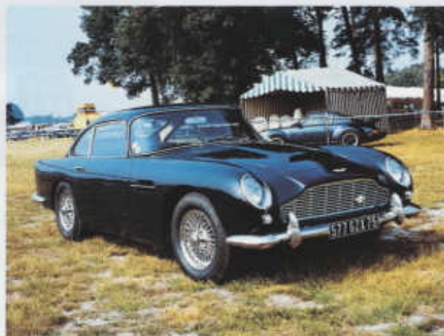
Kupé Aston Martin DB 5 se světlomety pod aerodynamickými kryty