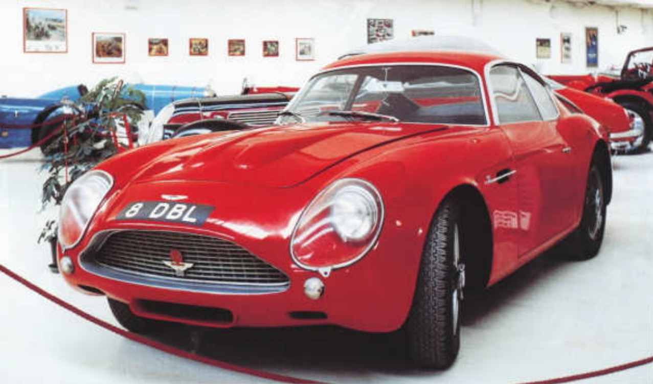
Vzácný kousek – aerodynamické kupé DB 4 GT Zagato ročníku 1962

ned dvojnásobnému. Otevřené sportovní vozy DBR 1 poháněné třilitrovým šestiválcem obsadily první dvě místa v cíli, když palmu vítězství získala britsko-americká dvojice Roy Salvadori a Carroll Shelby, zatímco druhý skončil francouzsko-belgický tandem Maurice Trintignant a Paul Frere. Navíc Aston Martin vyhrál v roce 1959 i mistrovství světa značek sportovních vozů, když předstihl Ferrari a Porsche.