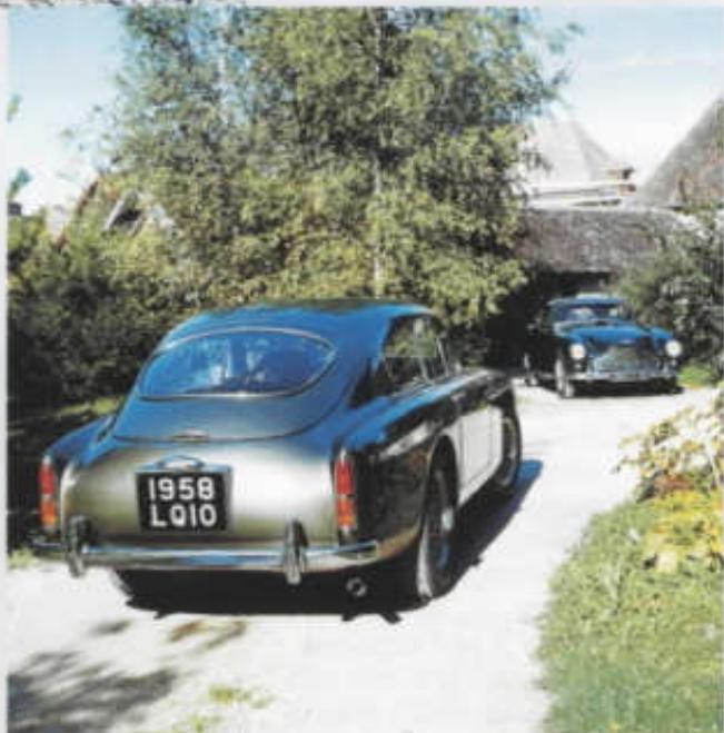
Zaoblená záď s třetími dveřmi byla typickou partií modelu DB Mk III

Skutečným průkopníkem nové éry se však stal až typ DB 2, zcela nový vůz poháněný již zmíněným šestiválcem 2,6 l, jenž se coby prototyp objevil v Le Mans