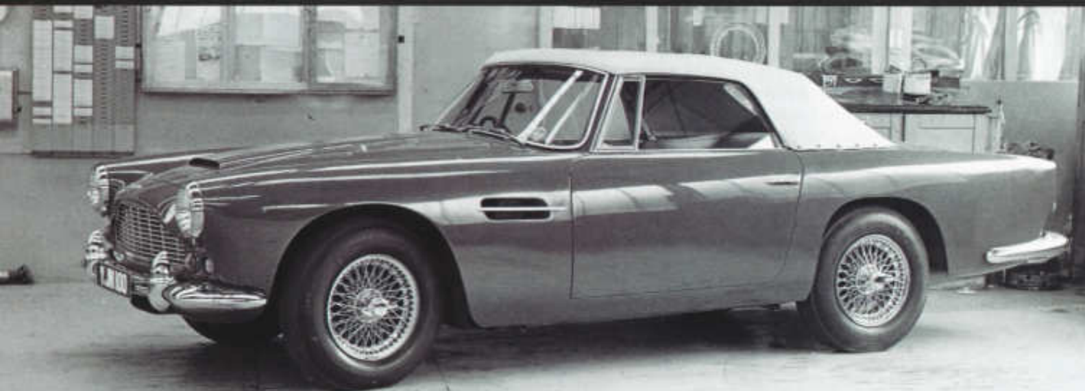
Kabriolet DB 4 ve vstupní hale mateřské továrny Newport Pagnell

Od podzimu 1961 existoval Aston Martin DB 4 i jako úhledný kabriolet, současně nabídku obohatila ostřejší