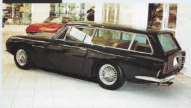
Poněkud objemná záď loveckého kombi DB 6 z karosárny Radford

V červenci 1969 prošel Aston Martin DB 6 inovací, jež se navenek projevila např. lemy kolem blatníků, a dostal označení DB 6 Mark II. Problémy spojené s vývojem a neúspěšným startem většího typu DBS vyráběného už od podzimu 1967 ovlivnily i závěr kariéry