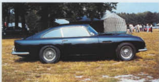
Klasický profil kupé Aston Martin DB 5 z poloviny 60. let

DB 6 Mk II, jež trvala do listopadu 1970. Vozů DB 6 druhé série se prodaly necelé tři stovky (včetně čtyř desítek kabrioletů), tedy zlomek ve srovnání s první sérií, jež čítala 1325 kupé a 140 otevřených vozů.