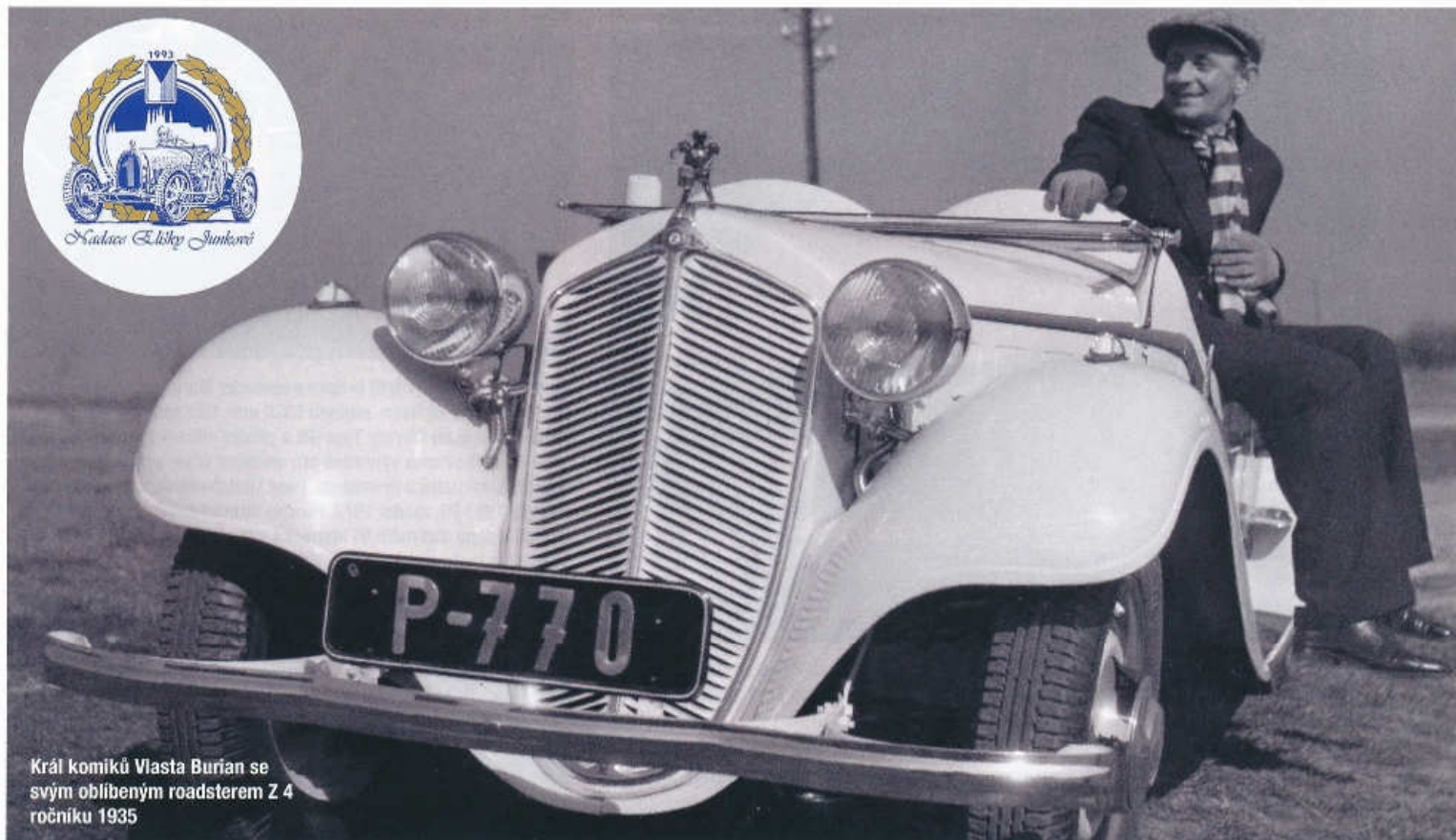
Král komiků Vlasta Burian se svým oblíbeným roadsterem Z 4 ročníku 1935