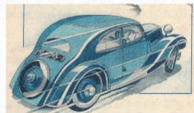
Uzavřené vozy Z 4 čtvrté série se vyznačovaly výrazněji profilovanou záďí

Poslední sériové vozy Z 4 byly smontovány v říjnu 1936, celkem jich od jara 1933 v pěti sériích vzniklo 2680. Ještě v říjnu 1937 měla Zbrojovka stánek na pražském autosalonu, vozy nabízela za snížené ceny a snažila se šířit zprávy o možném obnovení výroby automobilů, skutečnost však byla jiná. Válka byla za dveřmi a Zbrojovka se z příkazu vlády musela soustředit na svůj hlavní výrobní program. ■