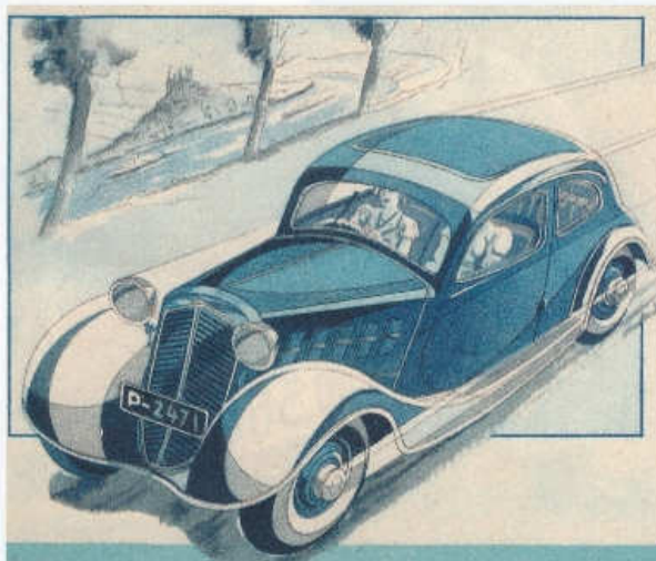
Limuzínka Z 4 čtvrté série ročníku 1935 na dynamické kresbě z perspektivy

Tvary třímístného roadsteru postaveného v roce 1935 navrhl Jindřich Dostál