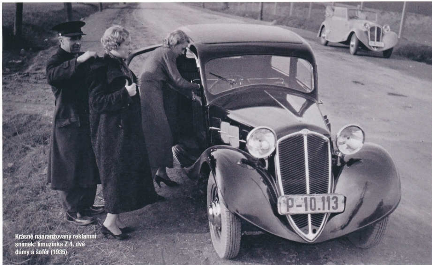
Krásně naaranžovaný reklamní snímek: limuzinka Z 4, dvě dámy a šofér (1935)

největší rychlosti kolem 100 km/h. Průměrně spotřebovala 8,5 litru dvoudobé směsi na 100 km, do nádrže umístěné na dělicí stěně motoru mohla natankovat 28 l paliva.