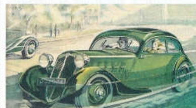
Obrázek na rozloučenou: takhle se Silná čtyřka páté série prezentovala v perspektivu