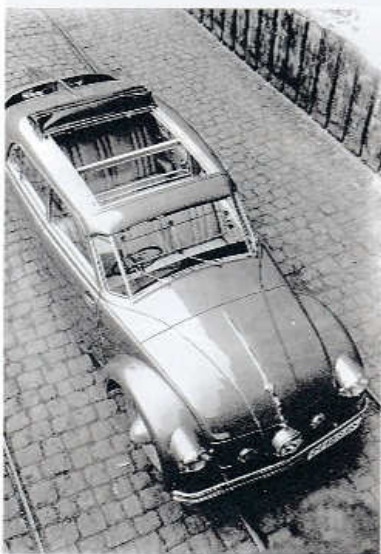
Tatra 77 A ročníku 1936 s přepážkou za řídicím a shrnovací střechou Webasto

vostní hmotnost kolem 1750 kg. Pod víkem v zaoblené přídi měla palivovou nádrž o objemu 80 l a vodorovně nad sebou uložena dvě náhradní kola. Prostor pro zavazadla byl jen vzadu, za opěradlem zadního sedadla. Vzhledem k velkorysému vnitřní šířce karoserie byl vůz označován jako šestimístný, se třemi místy na předním i na zadním sedadle.