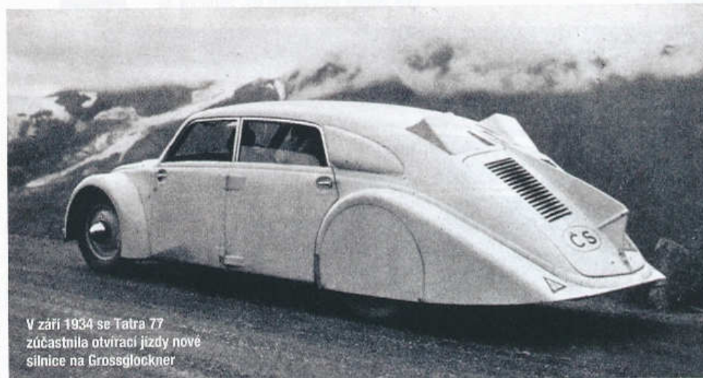
V září 1934 se Tatra 77 zúčastnila otvácí jízdy nové silnice na Grossglockner

Podélně za zadní nápravou uložený a vzduchem chlazený osmiválec do V 90° s rozvodem OHC dával z objemu 2970 cm 3 výkon 60 k (44 kW) při 3500 min -1 . Kupředu na motor navazovala rozvodovka a před zadní nápravou uložená čtyřstupňová převodovka. Poháněná zadní kola nesená výkvnými polonápravami byla odpružena horním příčným listovým perem.