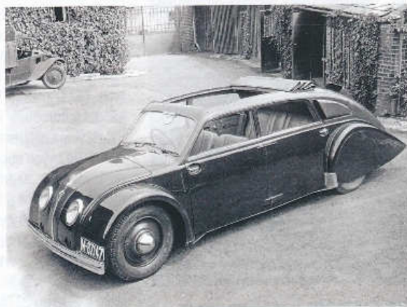
Tatra 77 ročníku 1934 se shrnovací střechou nad oběma řadami sedadel

Chlazení osmiválce zajišťovala dvojice ventilátorů umístěných po obou stranách motoru. Elektrická soustava vozu pracovala s napětím 12 V. Bubnové brzdy měly kapalinové ovládání, ruční brzda působila mechanicky na zadní kola. Při rozvoru náprav 3150 mm a rozchodu kol 1300 mm byla Tatra 77 dlouhá 5150 mm, široká 1700 mm a vysoká 1520 mm a vykazovala pohoto-