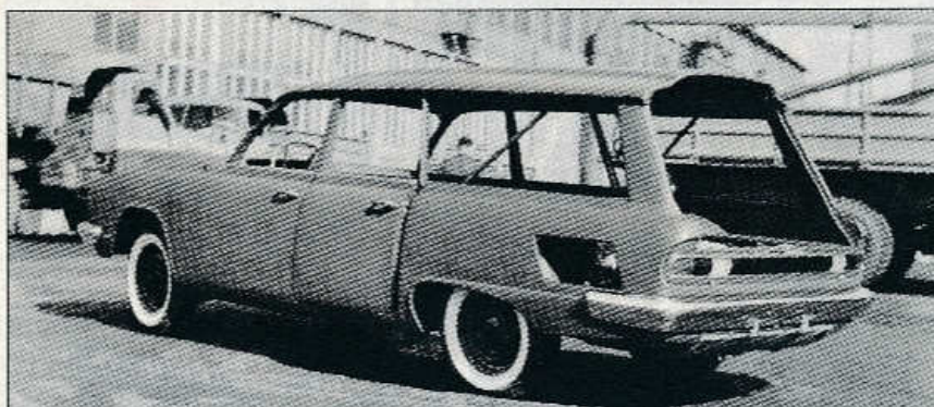
Vzácný snímek z roku 1963: rozpracovaný prototyp sanitky (nebo kombi?) navazující na připravovaný sedan Tatra 603 A.

Prototyp sanitky údajně od svého do- končení v roce 1964 najel víc než 400 tisíc kilometrů, stejně jako celý projekt T 603 A však zůstal stát na slepé kole- ji. Zajímavou kapitolu kopřivnické his- torie však kromě sanitky ještě dlouho připomínal i prototyp sedanu Tatra 603 A, který s novojičínskou poznávací značkou jezdil v běžném provozu ještě v osmdesátých letech. JAN TUČEK