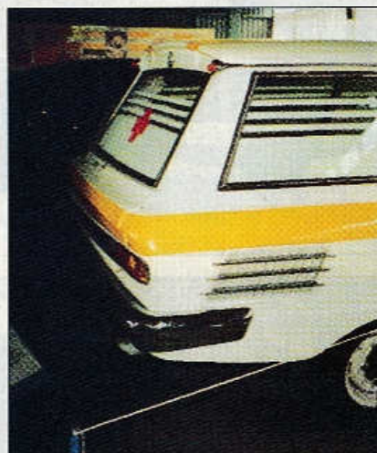
Detail zadní části karoserie prototy- pu sanitky T 603 A.