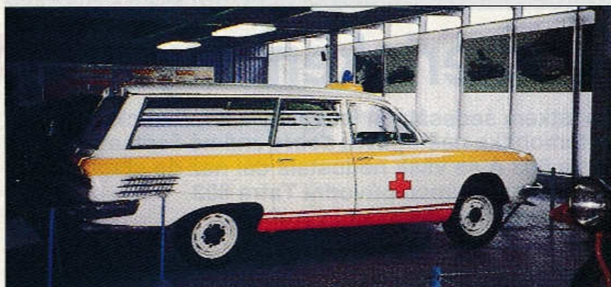
Slušně zrestauro- vaná sanitka T 603 A patří k nejzajim- avějším exponátům kopřivnické sbírky.