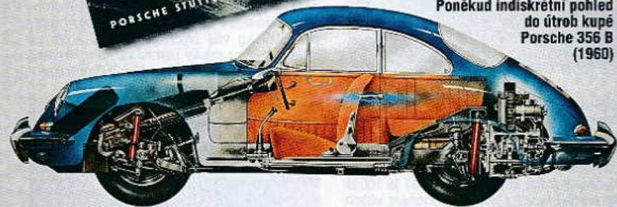
Poněkud indiskrétní pohled do útroby kupé Porsche 356 B (1960)

nými světlomety a zvýšenou linií předních blatníků. Typové označení se změnilo na 356 B, otevřený dvoumístný model s karoserií Drauz byl přejmenován na roadster. V únoru 1961 převzala jeho výrobu bruselská karosárna D'leteren, v létě téhož roku ji však ukončila a roadster zmizel z nabídky. Standardním motorem byl od léta 1958 čtyřválec OHV 1582 cm 3 o výkonu 60 k (44 kW) nebo 75 k (55 kW), od jara 1960 se prodával model Super 90 s tímž motorem naladěným na 90 k (66 kW). Kupé s rozvorem 2100 mm, délkou 4010 mm, šířkou 1670 mm, výškou 1330 mm a pohotovostní hmotností 920 kg s ním dosahovalo rychlosti 180 km/h. V září 1961 následovala další inovace karose-