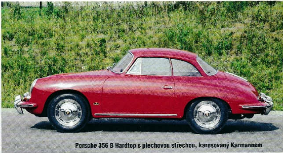
Porsche 356 B Hardtop s plechovou střechou, karosovaný Karmannem