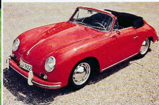
Kabriolet Porsche 356 s karoserií od stuttgartské firmy Reutter (1957)