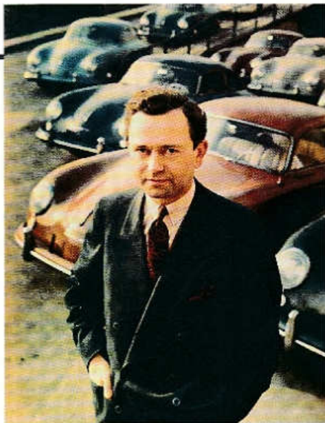
Pětačtyřicetiletý Ferry Porsche s vozy typu 356 v roce 1954