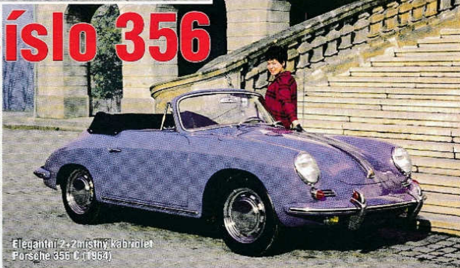
Elegantní 2+2místný kabriolet Porsche 356 C (1964)