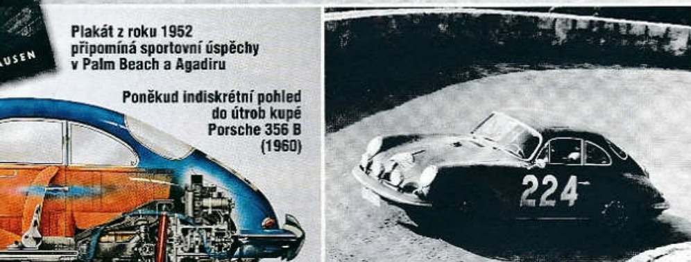
Porsche 356 C Carrera 2 na trati Rallye Monte Carlo 1964