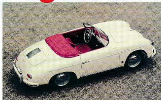
Porsche 356 A Speedster s nízkým čelním sklem (1958)