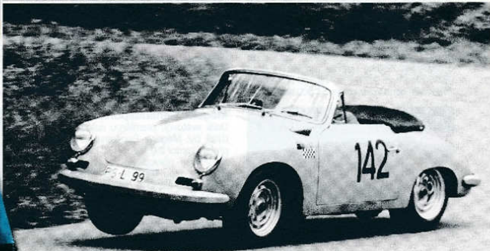
Jen na třech kolech – kabriolet Porsche 356 B Carrera 2 (1963)