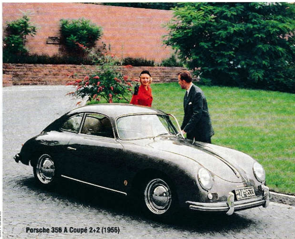
Porsche 356 A Coupé 2+2 (1956)