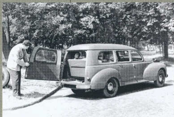
KOMBI 203 FAMILIALE S TROJÚHELNÍKOVÝMI OKENKY V PŘEDNÍCH DVEŘÍCH (1951)