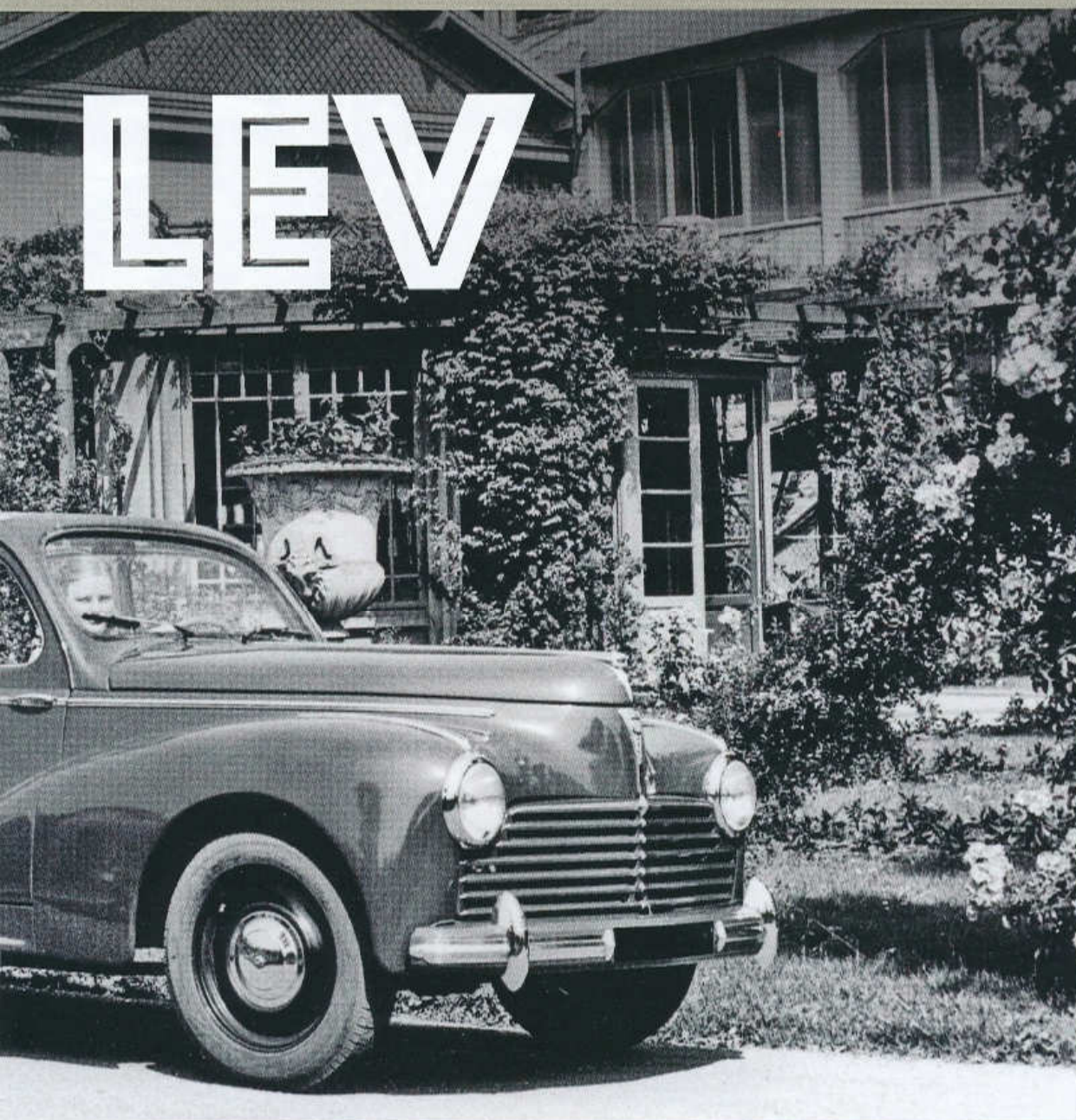
ČTYRĎVEŘOVÝ POLOKABRIOLET PEUGEOT 203 V PRVNÍM PROVEDENÍ Z ROKU 1949