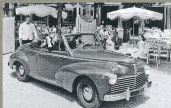
JEDEN Z PRVNÍCH KABRIOLETŮ PEUGEOT 203 NA SNÍMKU POŘIZENĚM V LÉTĚ 1951

› pružinami. Vůz měl hřebenové řízení a bubnové brzdy s kapalinovým ovládním.