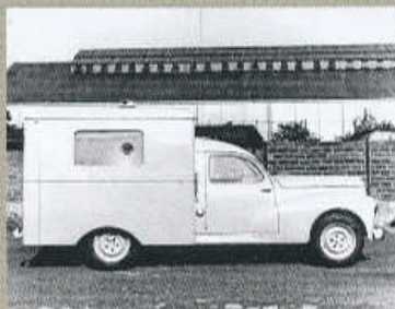
V LETECH 1949 AŽ 1957 V SOCHAUX VYROBILI 1280 SANITNÍCH VOZŮ PEUGEOT 203

Od října 1952 měly všechny osobní vozy Peugeot 203 novou palubní desku s půlkruhovým sdruženým přístrojem, volant se dvěma příčkami místo dřívějších čtyř a trojúhelníková větrací okénka v předních dveřích.