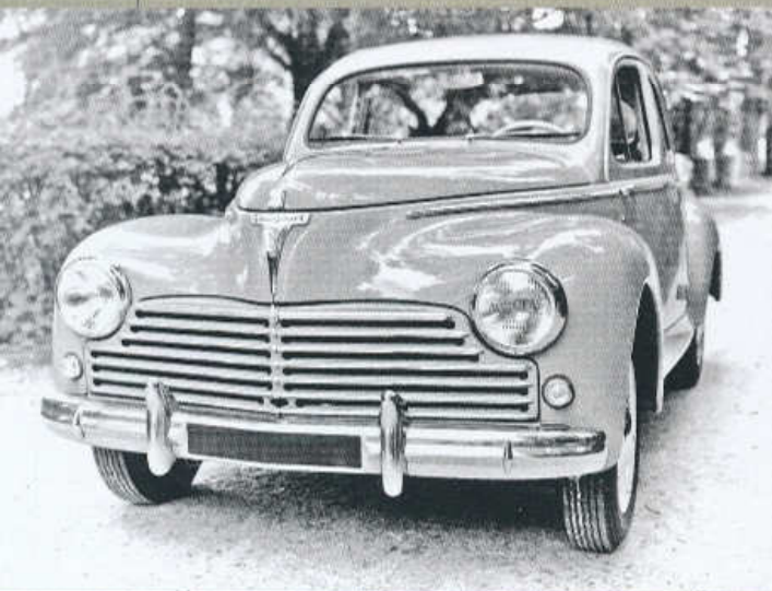
PŘÍD SEDANU PEUGEOT 203 ROČNÍKU 1959. UŽ BEZ PLASTIKY LVÍ HLAVY NA KAPOTĚ

Poslední Peugeot 203 opustil výrobní linku 26. února 1960. Z celkové produkce téměř 686 tisíc „dvěstětrojek“ bylo 496 tisíc sedanů, polokabrioletů, kabrioletů a kupé a 70 tisíc kombi, zbytek tvořily užitkové verze. <