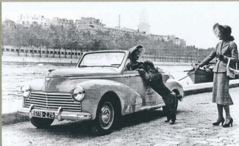
V LÉTĚ 1951 NA NABŘEŽÍ SEINY: DÁMY S PEJSKEM A KABRIOLETEM PEUGEOT 203

nákladního prostoru o objemu 2 m 3 . Nabídku doplňoval valník s dvoumístnou kabinou a dřevěnou korbou krytou plachtou, na temže upraveném podvozku s pomocným rámem byla postavena i sanitka s krabicovitou nástavbou pro dva ležící pacienty. Stejnou nástavbu jako sanitka, ale bez bočních oken, měl i furgon vyráběný v letech 1950 až 1952.