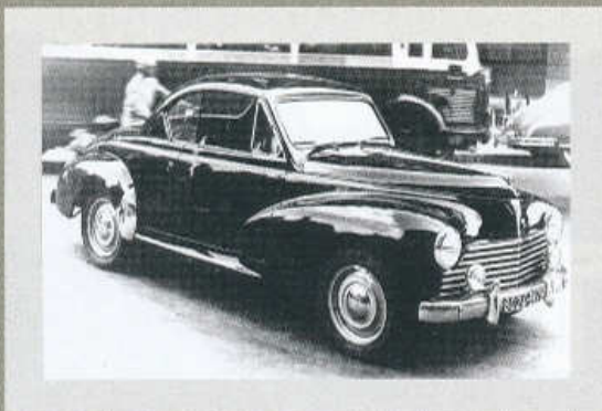
VZÁCNÝ EXEMPLÁŘ: V LETECH 1952 AŽ 1954 VZNIKLO JEN 955 KUPÉ PEUGEOT 203