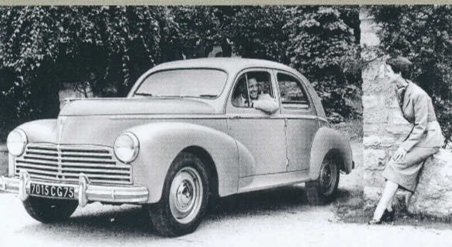
SEDAN PEUGEOT 203 MODELOVÉHO ROKU 1954 S NOVĚ TVAROVANÝM NÁRAZNIKEM