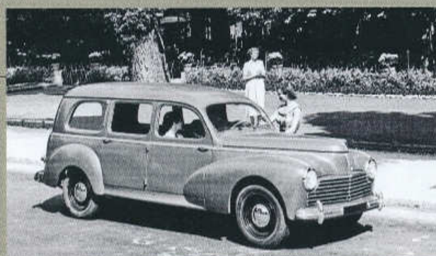
ŠESTIMÍSTNÉ KOMBI PEUGEOT 203 FAMILIALE SE TŘEMI ŘADAMI SEDADEL (1950)

levnější sedan s označením 203 Affaires, který se obešel bez poklic kol, ozdobných lišt i bez topení.