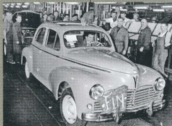
POSLEDNÍ PEUGEOT 203 OPUSTIL VÝROBNÍ LINKU ZAVODU V SOCHAUX 26. ÚNORA 1960