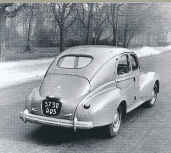
SPLÝVAVÁ ZÁŘ SEDANU 203 SE DVĚMA KLIKAMI VÍKA ZAVAZADELNÍKU (1948-49)