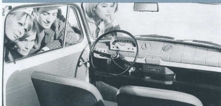
PALUBNÍ DESKA „OSMSETPADESÁTKY“ VE STANDARDNÍM PROVEDENÍ (1964)