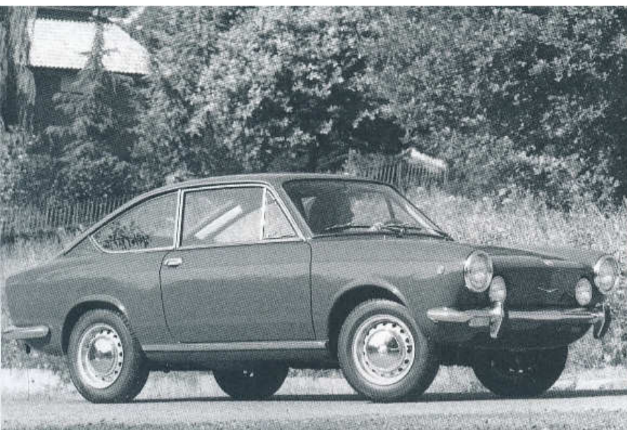
▲ FIAT 850 SPORT COUPÉ MĚL DVA PÁRY SVĚTLOMETŮ I ZADNÍCH SVĚTEL (1968)

byla montáž většího motoru 903 cm 3 o výkonu 52 k (38 kW), díky němuž maximální rychlost těchto vozů vzrostla na 145 a 150 km/h. Nový čtyřválec byl vybaven alternátorem místo dynama.