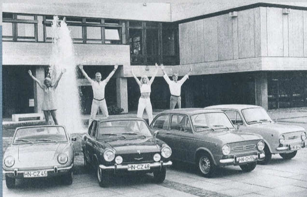
▼ KOMPLETNÍ RODINKA AUTOMOBILŮ FIAT 850 MODELOVÉHO ROČNÍKU 1969

V březnu 1968 byly v Ženevě představeny inovované modely s označením 850 Sport Coupé a 850 Sport Spider. Hlavní novinkou