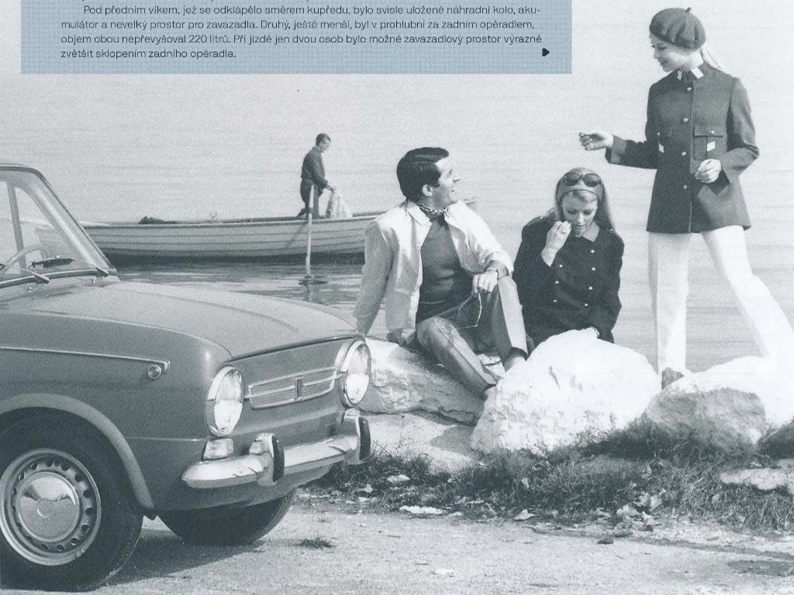
FIAT 850 SPECIAL ROČNÍKU 1968 PATŘIL K MÓDNÍM VOZŮM SVE DOBY

Pod předním víkem, jež se odklápělo směrem kupředu, bylo svisle uloženo náhradní kolo, akumulátor a nevelký prostor pro zavazadla. Druhý, ještě menší, byl v prohlubni za zadním opěradlem, objem obou nepřevyšoval 220 litrů. Při jízdě jen dvou osob bylo možné zavazadlový prostor výrazně zvětšit sklopením zadního opěradla.