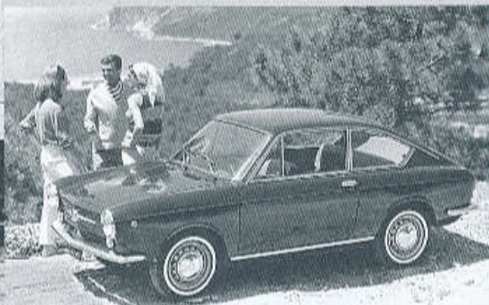
▲ FIAT 850 COUPÉ S TOVÁRNÍ KAROSERÍÍ V PŘEVEDENÍ Z LET 1965 AŽ 1968