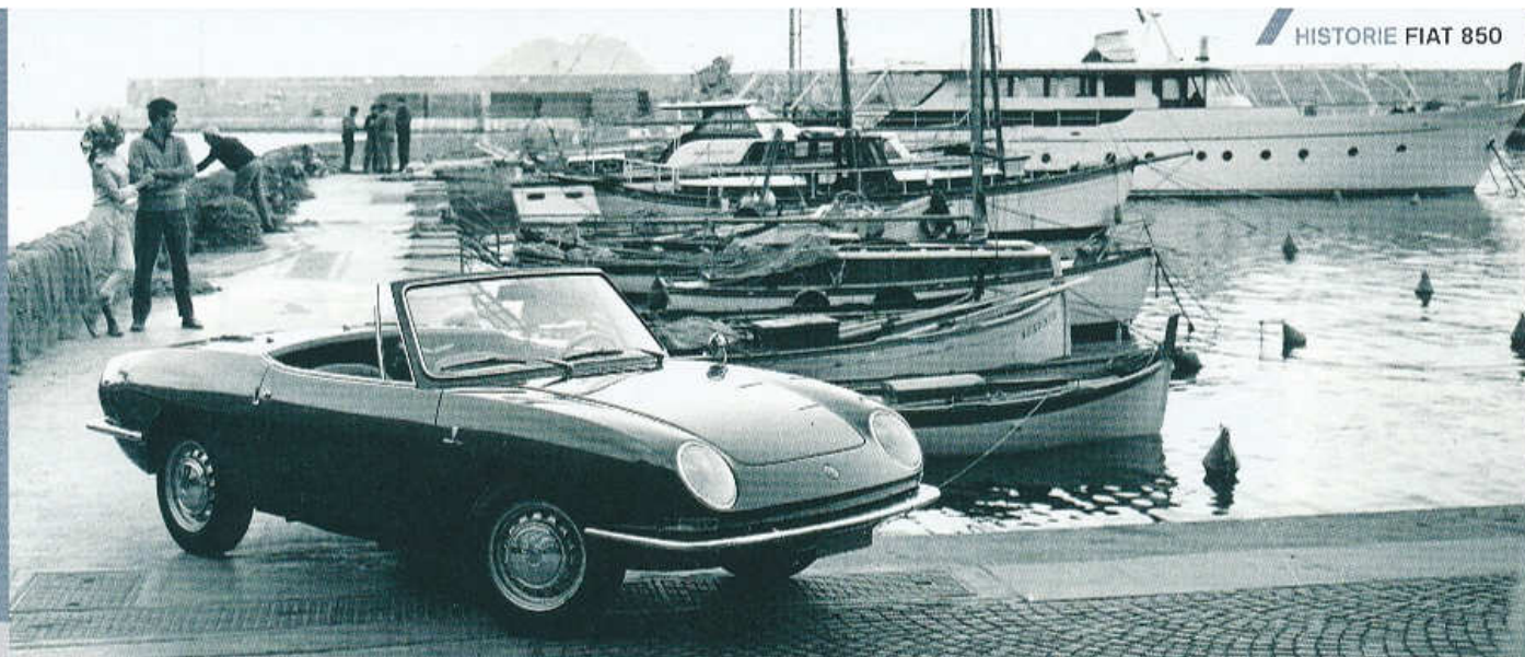
▲ FIAT 850 SPIDER S KAROSERIÍ BERTONE A KRYTÝ SVĚTLOMETŮ (1965–68)

► Při rozvoru náprav 2027 mm a rozchodu kol 1146 mm vpředu a 1211 mm vzadu byla „osmsetpadesátka“ dlouhá 3575 mm, široká 1425 mm a vysoká 1385 mm. I na ni se vztahovalo známé úsloví, že malé vozy Fiat jsou zevnitř větší, než zvenku. Pozoruhodné bylo i to, že se Fiat 850 s pohotovostní hmotností 670 kg mohl pochlubit užitečnou hmotností 400 kg a byl schopen přepravovat čtyři dospělé cestující a 50 kg zavazadel.