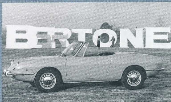
▲ STOTISÍCI OTEVŘENÁ „OSMSETPĚDESÁTKA“ OD BERTONEHO Z LEDNA 1971

Fiat 850 s karoserií tudor se vyráběl do léta 1972, jeho produkce dosáhla 2,3 miliony kusů. Poté jeho výroba pokračovala pod značkou SEAT ve Španělsku, kde se dočkal i prodloužené čtyřdveřové verze.