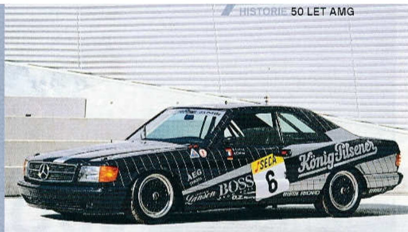
▲ NABROUŠENÝ OKRUHOVÝ MERCEDES-BENZ 500 SEC AMG V PŘEVODĚNÍ Z ROKU 1989