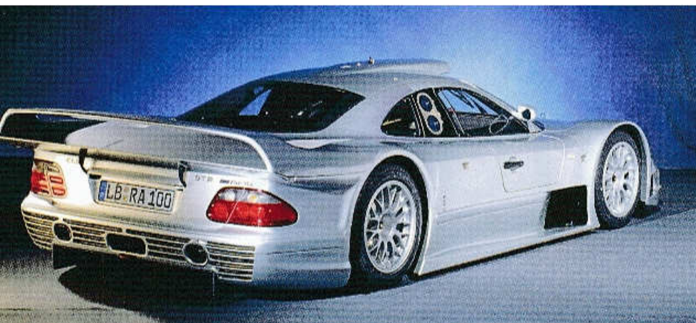
▲ SILNIČNÍ VERZE SUPERSPORTU CLK-GTR S MOTOREM V12 PŘED ZADNÍ NÁPRAVOU (1998)

pozoruhodná supersportovní kupé CLK-GTR se šestiliterovým motorem V12 o výkonu 600 k (441 kW) před zadní nápravou, v roce 1998 pak také otevřené vozy CLK-LIM téže koncepce, ale s pětilitrovými motorem V8.