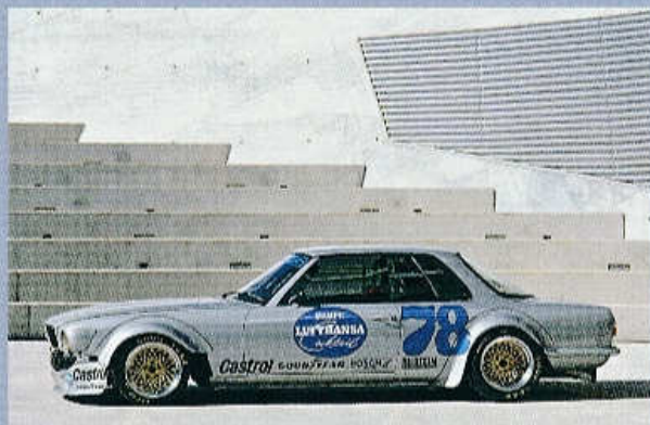
▲ MERCEDES-BENZ 450 SLC AMG TRIUMFOVAL NA NÜRBURGRINGU V SEZONĚ 1980