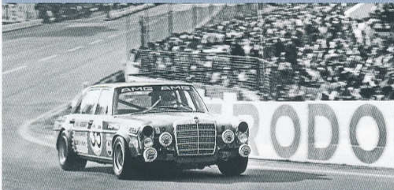
MOHUTNÝ ČERVENÝ SEDAN POHÁNĚL MOTOR V8 VYLADĚNÝ U AMG NA 280 K