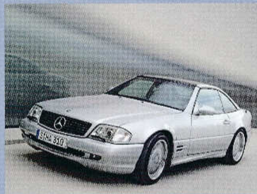
▲ MERCEDES-BENZ SL 73 AMG S MOTOREM V12 O OBJEMU 7,3 L A VÝKONU 525 K (1999)

Špičku komerční nabídky představoval v sezoně 1999 roadster Mercedes-Benz SL 73 AMG s motorem V12 o objemu 7,3 l a výkonu 525 k (386 kW), v té době nejvýkonnější otevřený vůz na světovém trhu.