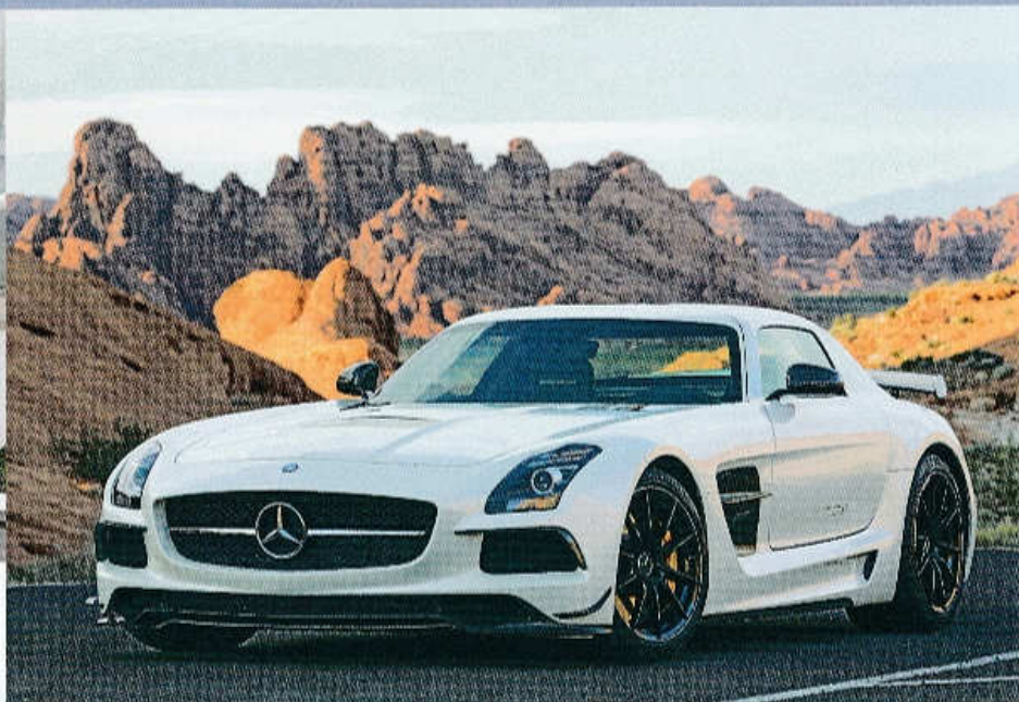
▲ S MOTOREM V8 VPŘEDU A PŘEVODOVKOU VZADU: MERCEDES-BENZ SLS AMG (2012)

Hvězdou novodobé historie v rámci koncernu Daimler AG se stalo supersportovní kupé Mercedes-Benz SLS AMG představené v létě 2009. Za přední nápravu dostalo motor V8 o objemu 6,2 l a výkonu 571 k (420 kW), točivý moment se k zadním poháněným kolům přenášel prostřednictvím vzadu uložené sedmistupňové dvouspojkové převodovky. A třešničkou na dortu byly legendární křídlaté dveře. ◀