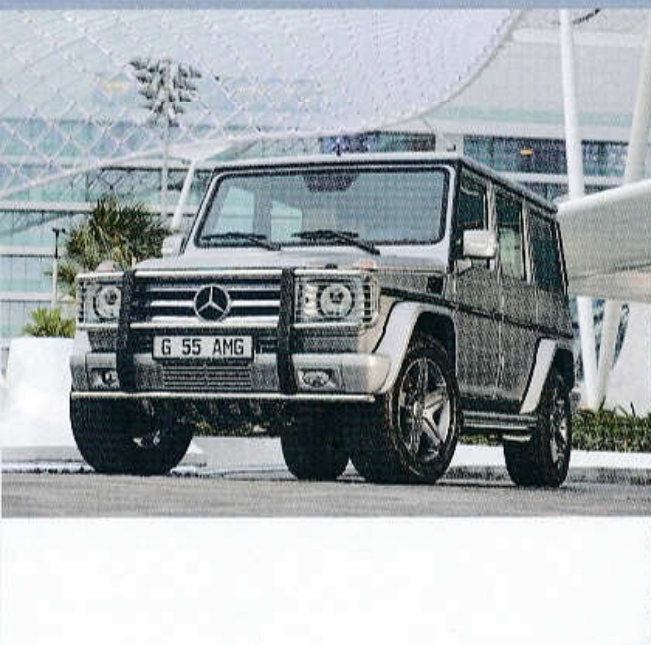
▲ MOHUTNÝ A DRSNÝ: MERCEDES-BENZ G 55 AMG KOMPRESSOR S POHONEM 4 X 4 (2009)